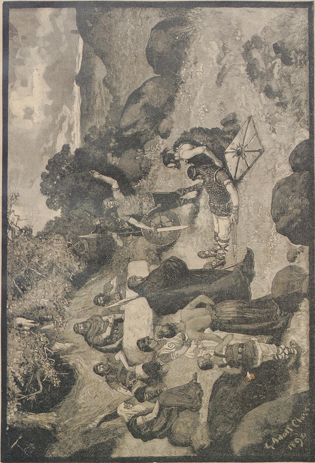
Germanisches Gericht im 9. Jahrhundert n. Chr. Nach einer Zeichnung von G. A. Glob.