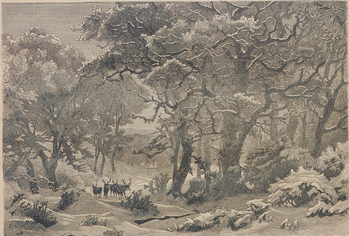
Der Winter im Walde.