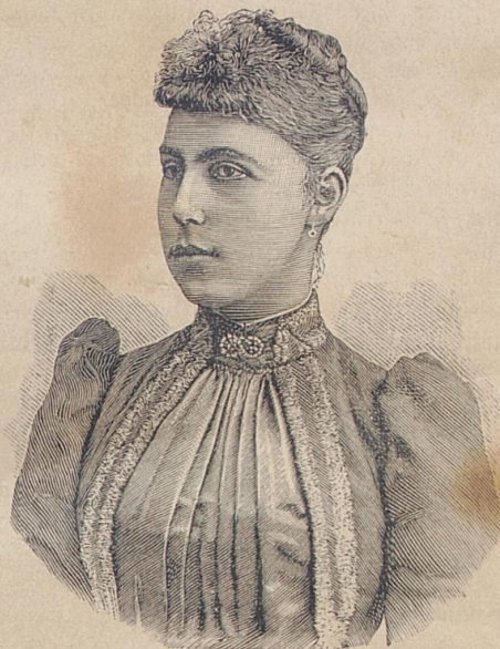
Großherzog Ernst Ludwig von Hessen und seine Braut Prinzessin Viktoria von Sachsen-Coburg-Gotha.

Wichtigste, zunächst das Hinderniß wegzuräumen, welches unerwartet zwischen die Braut und die Million getreten war? „Aber,“ fügte Volkmar dieser Reflexion hinzu, indem er plötzlich den Kopf schüttelte und die Hand auf's Herz legte, „hat denn ein Mensch, der die Katastrophe eines Schiffsuntergangs durchmacht, nicht das Recht, Nerven zu besitzen und in Folge der ausgestandenen Angst und Aufregung in eine Krankheit zu verfallen, die ihn einige Tage in Calais zurückhält? Da bildete ich mir nun ein, daß der spitzfindige Jurist aus mir spräche, und am Ende ist es weiter nichts, als die Scheelsucht des mißvergünstigten Liebhabers, welche mich die schmachvollsten Verdächtigungen auf jenen Herrn von Harnisch häufen läßt. Und warum? Weil das Mädchen, welches ich gern selbst besitzen möchte, in aufopfernder Kindesliebe für ihren Vater bereit war, jenen zu heirathen. Es ist ganz gemeine Eifersucht, der ich da das