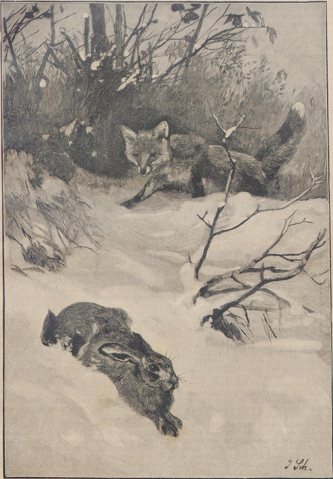
Auf dem Raubzuge.