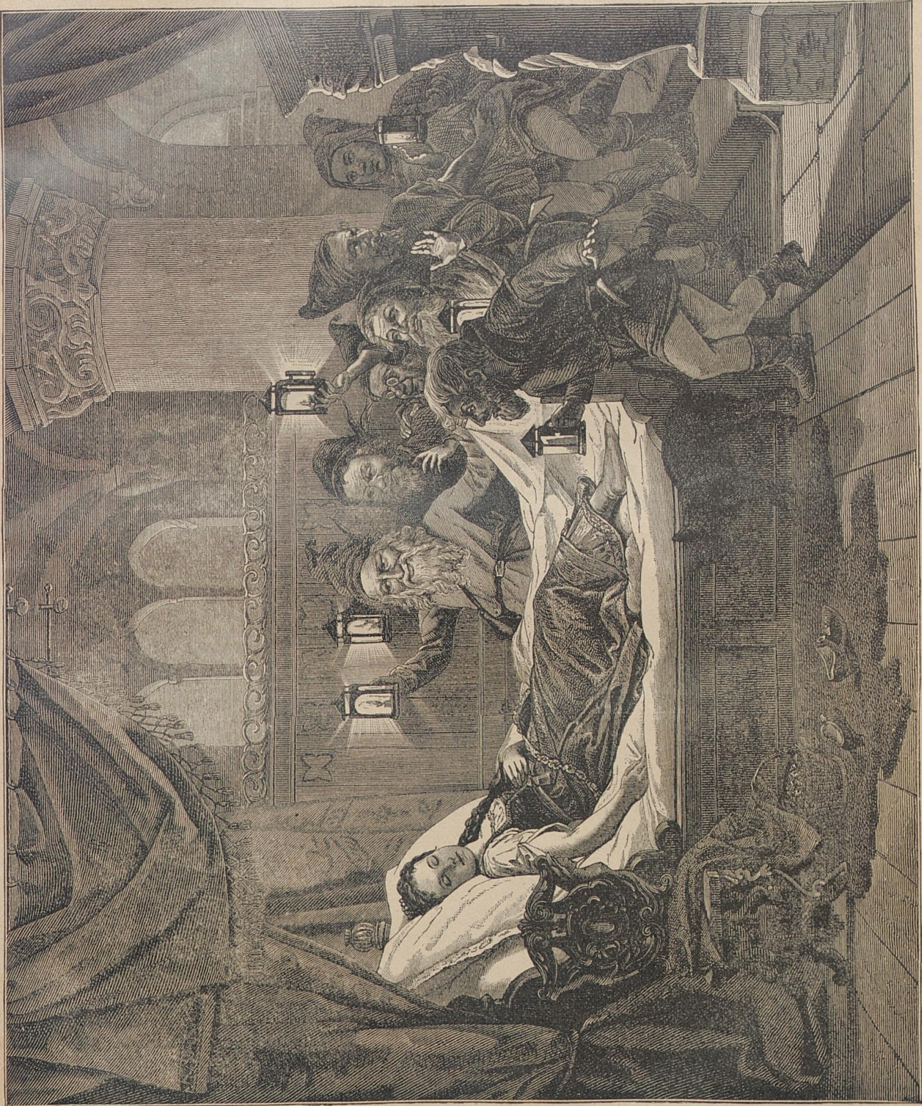
Schneewittchen und die 7 Zwerge.