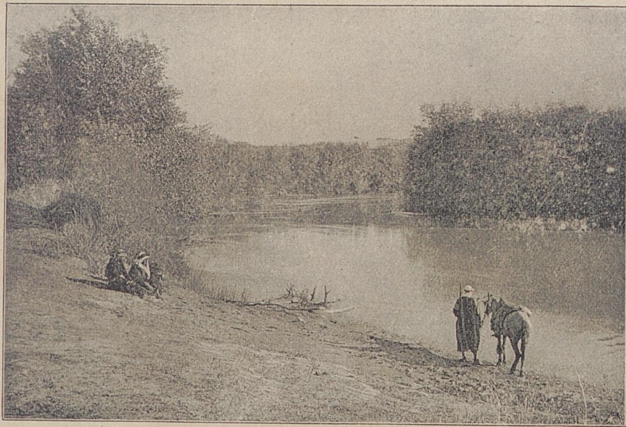
Am Ufer des Jordan.

oleon I. wick dem Ansturm der Allirten, die den Frieden Europas auf ihre Fahnen geschrieben, er wollte dem wieder „königlich“ gewordenen Frankreich den Rücken kehren und fliehen, auf seinen Kopf setzte der neue Bourbon einen hohen Preis, da nahm ihn das angerufene großmüthige England in sichere Hut und führte ihn auf dem