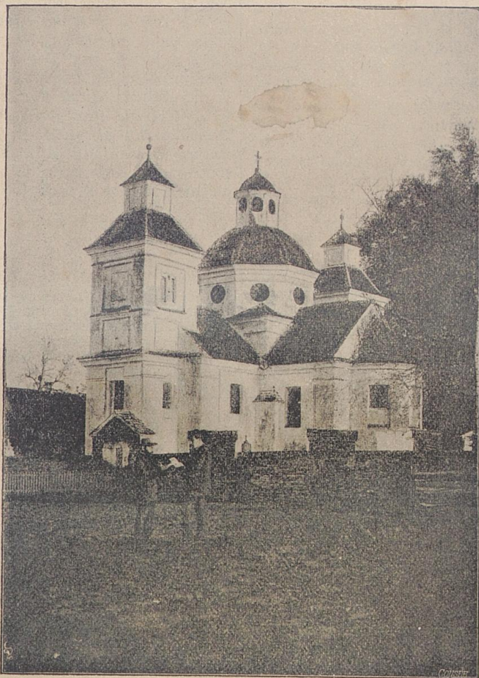
Muttergottes-Kapelle bei Binswangen.

Die dem hl. Nikolaus geweihte Pfarrkirche wurde im Jahre 1739 vom Domkapitel als Großzehntherr vollständig neu gebaut, aber erst am 4. Juni 1780 vom Weihbischof v. Ungelter eingeweiht. — Heute zählt die Pfarrei Binswangen ca. 880 Seelen.