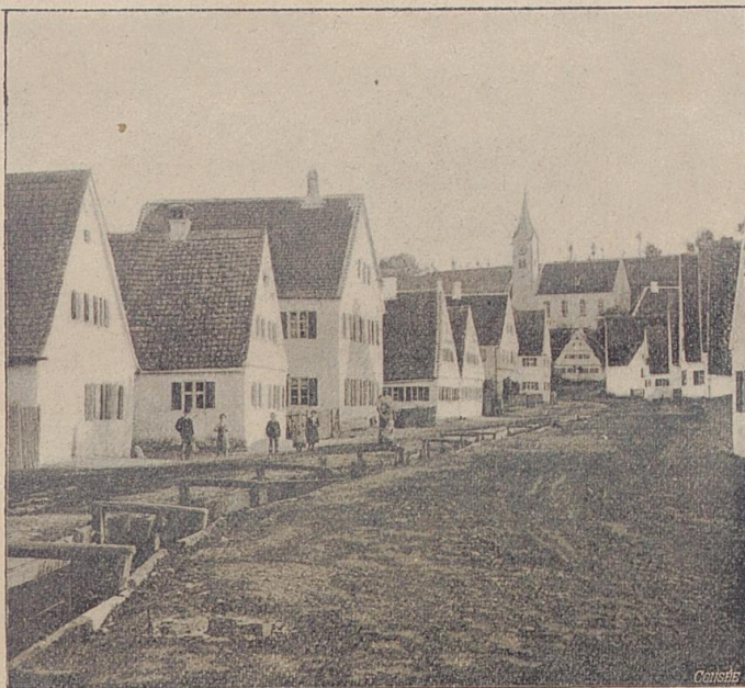
Strasse in Binzwangen mit Pfarckirche.