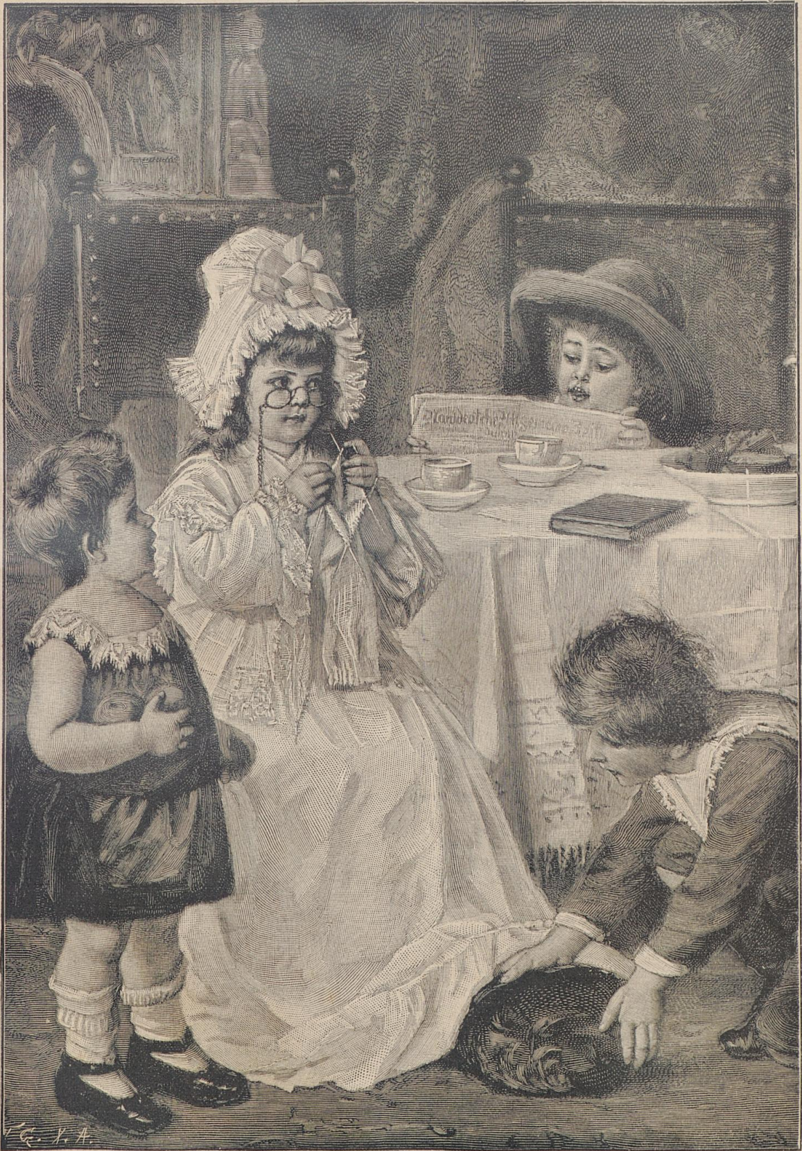
A. Ludwig. Die kleine Großmama.