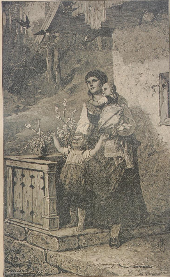
Die Schwalben sind wieder da! Von W. Koege.

„Mein liebes Kind,“ versetzte Hanna sehr ernst, „was ich glaube oder nicht, kommt gar nicht mehr in Betracht der Thatsache gegenüber, daß Herr Steindorf trotz alledem seinen Zweck erreicht hat. Nur mit dieser schwerwiegenden Thatsache haben wir jetzt zu rechnen. Sie haben das Kind dieses Mannes, welcher Sie einst