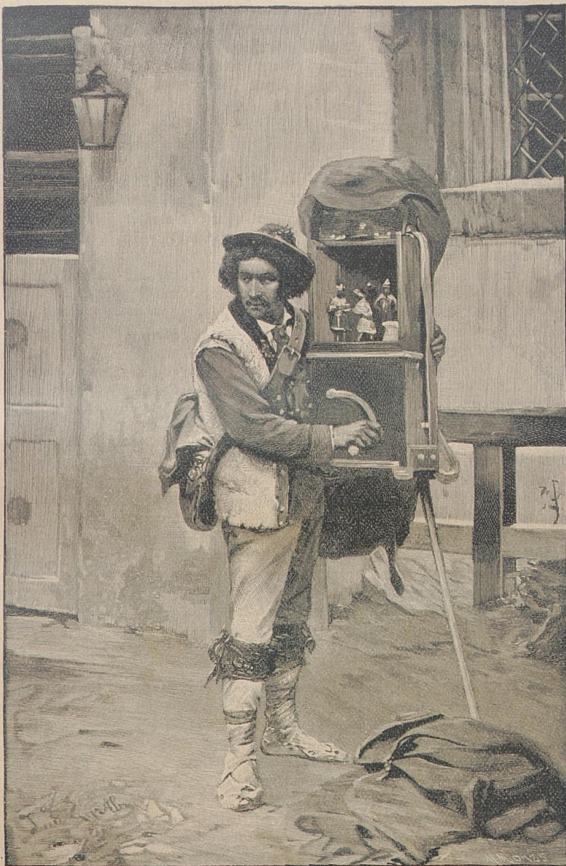
Auch ein Künstler. Nach einem Originalgemälde von L. Corella.

Er folgte rasch dem Freunde, der in lebhafter Unterhaltung mit Armgard dem Ausgange zugeschritten