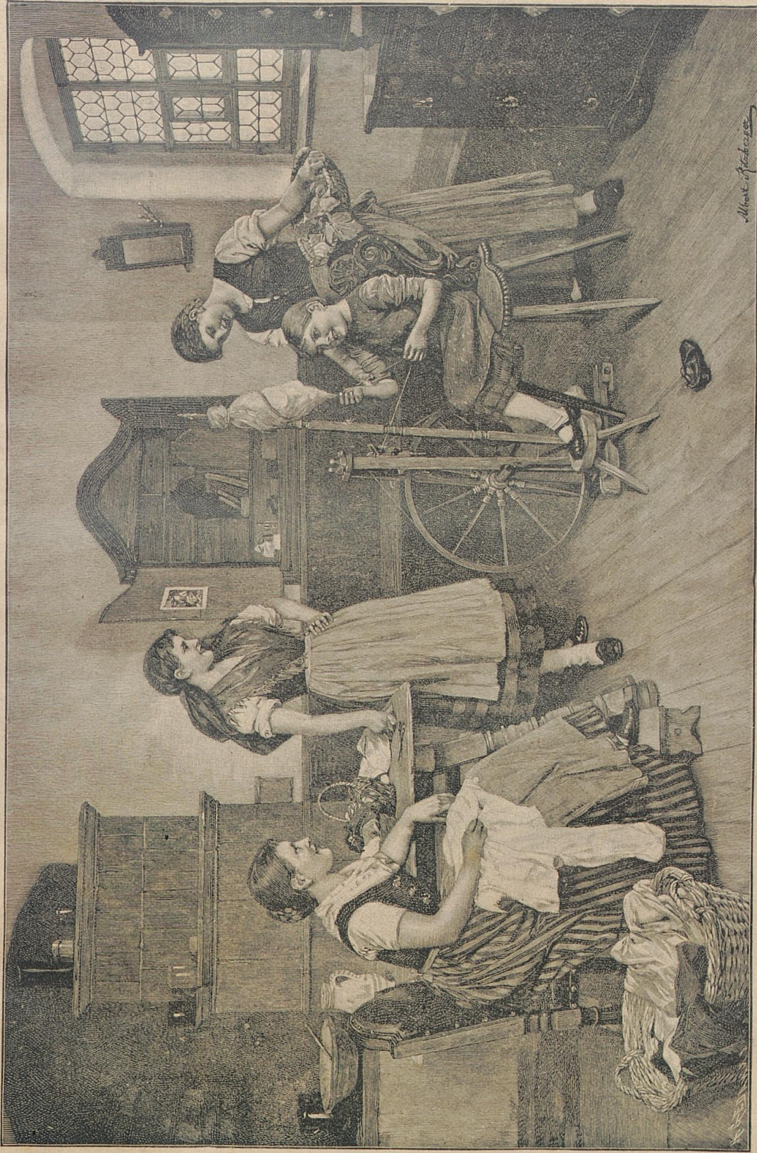
Die kleine Spinnerin. Nach dem Gemälde von M. Nibberger.