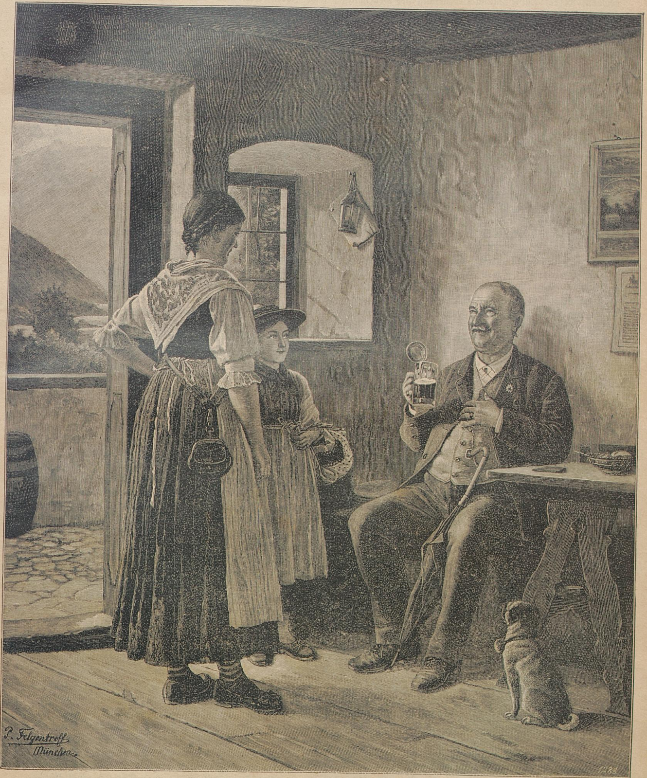
Ein Labetrunk. Nach einem Originalgemälde von P. Felgentreff. Photographie im Verlage von Franz Hanfstaengl, Kunstverlag, N. O., in München.