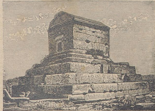
Grabmal des Cyrus.

Sie bringt 1. den ganzen, vollständigen Bibeltext