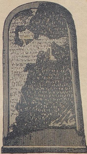
Siegessäule des Königs Mesa.

Wenn er das Grabmal des Cyrus betrachtet, wie es noch heute zu Parsargada steht, so taucht die Zeit der alten Perserkönige vor seinem Geiste auf, und wenn er die Opferstätte des Elias auf dem Karmel im Bilde dargestellt sieht, wie sie heute noch vorhanden ist, oder die Ueberreste der salomonischen Tempelmauern, aufge-