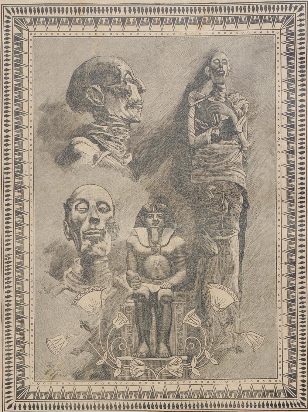
Mumie und Statue Ramses' II.

Mesa über seinen Abfall von Ahab, über die Streifzüge und Städte-Eroberungen, die er dem Abfall folgen ließ, über das Herannahen des israelitischen Königs, ferner, wie dieser dann eine Stadt nördlich von Dibon begründet