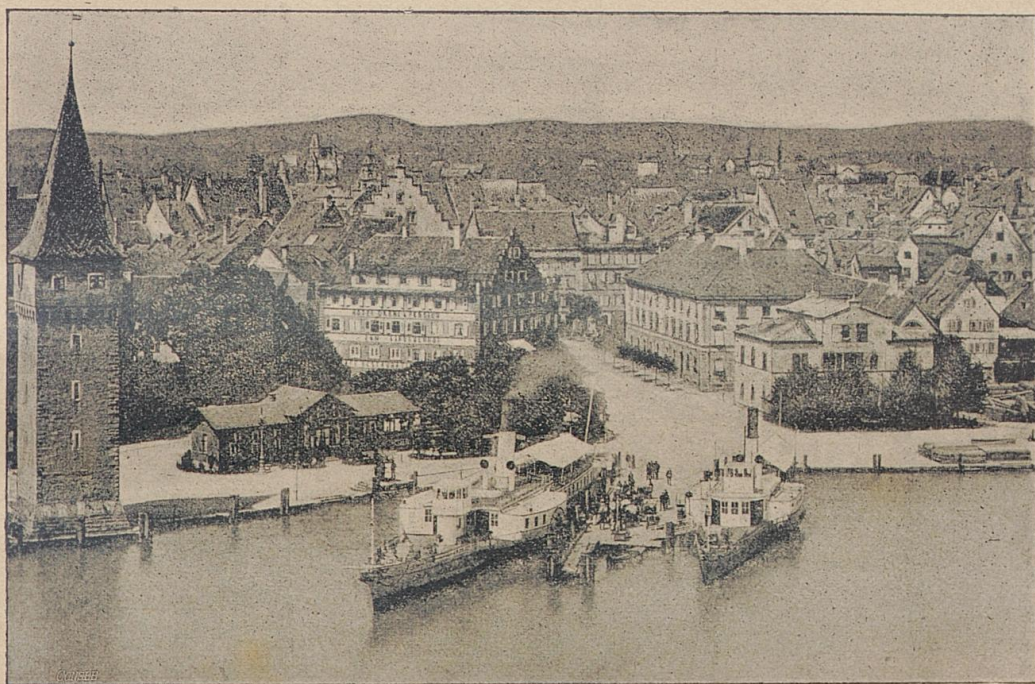
Stadt Pindau (vom Hafen aus).

von 1542 wegen der Aufnahme eines Wafenmeisterssohnes in die Lehre wiederholen. Die Weigerung berief sich auf den Umstand, daß Friedrich die unter den Schergen gestandenen Personen angetastet habe. Dagegen machte der Rath mit Recht geltend, daß die Reichspolizei-Ordnungen von 1548 und 1577 außer dem Scharfrichter Niemand kennen, welchen eine dienstliche Verrichtung ehrlos machte, und die Schau mußte sich fügen; doch erhielt sie die Versicherung, der Rath werde ihren guten Namen zu schützen wissen, falls er angegriffen werden sollte. Die Knappen gaben sich dadurch nicht zufrieden, und sie schlossen Friedrichs Gesellen, neben denen sie nicht sitzen wollten, von der Auflage aus. Es wurden von den Reichsstädten Cöln, Nürnberg und Memmingen Gutachten eingeholt, und auf Grund derselben erging an die Büchsenmeister der Befehl, die angefeindeten Gesellen, welchen allerdings das Züchtigen der Sträflinge untersagt wurde,