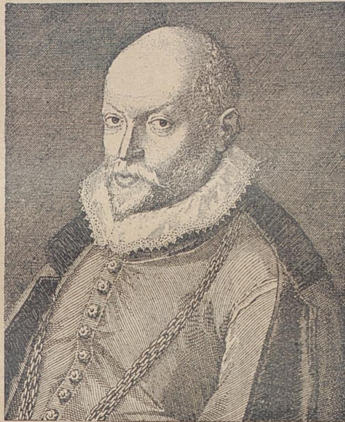
Orlando di Lasso.