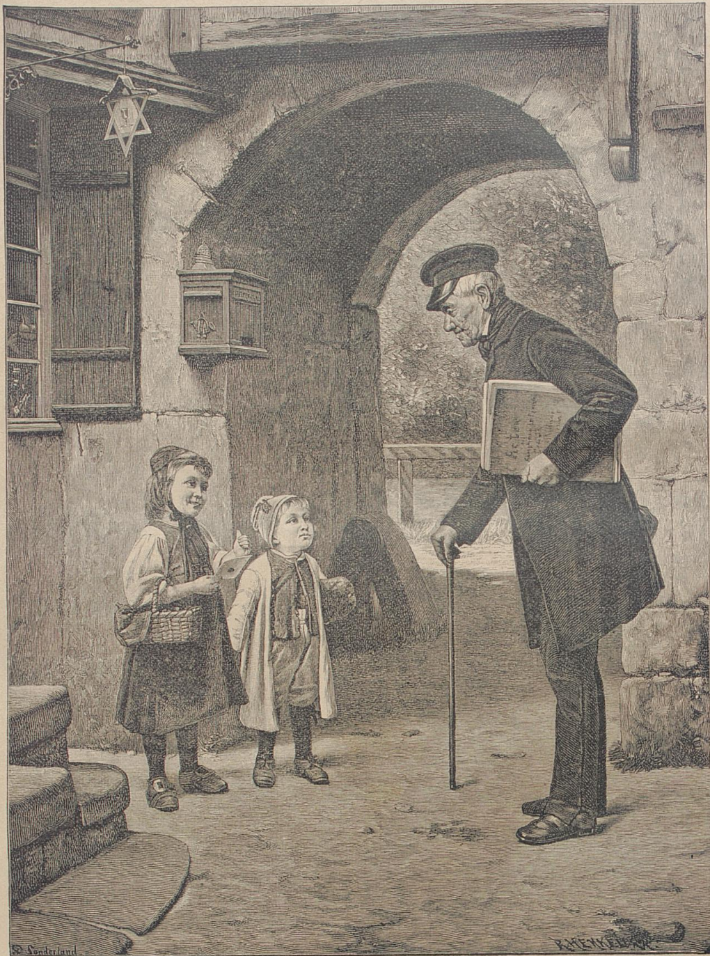
Zu hoch! Nach dem Gemälde von F. Sonderland.

und Salmansweil ihren ersten Abt Anselm. Aber Olching und seine Zugehörung waren nicht des Fürsten eigen Gut, sondern Lehngut, weshalb er es wieder an sich nahm und andere Güter zu Buch den Mönchen über-