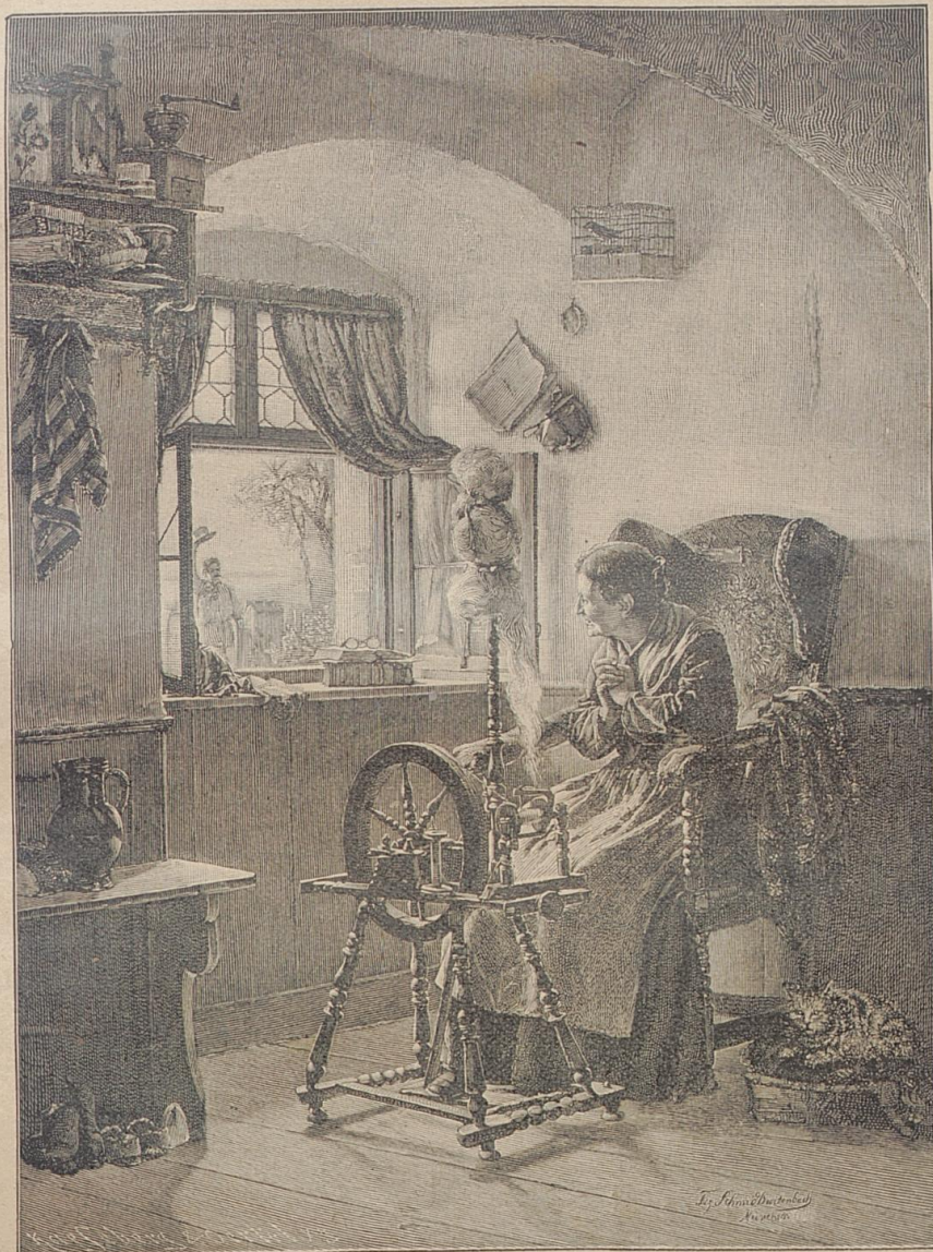
Mein Sohn kommt! Nach dem Gemälde von Frz. Schmid-Breitenbach.

Präsident an Stelle des zurückgetretenen Dupuy. Im Mai dieses Jahres trat er unerwartet, als die Kammer ihm in der Frage der Betheiligung der staatlichen Eisenbahn-Angestellten an dem Arbeitersyndicat nicht Recht gab, zurück. Die Kammer gab ihm ein Vertrauensvotum, indem sie ihn auf's Neue zum ersten Präsidenten wählte. —