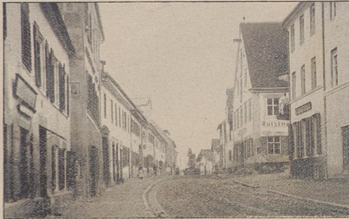
Johannisstraße in Dieffen.

Ich sitze am Süden der von dem leider zu früh