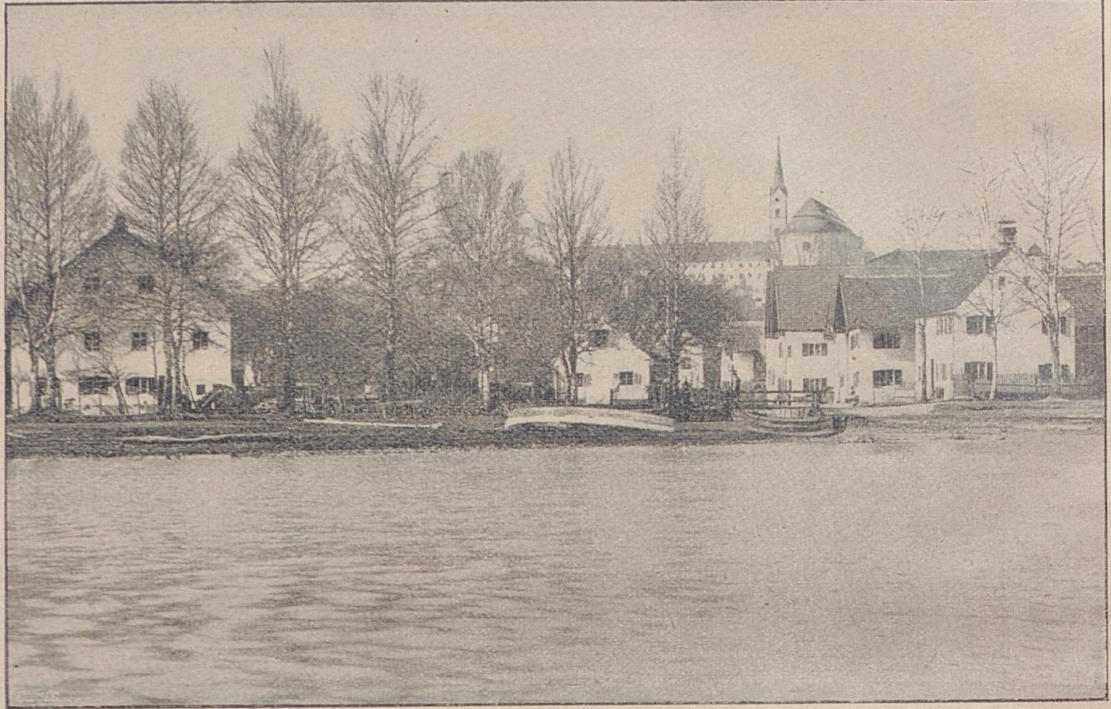
Dieffen am Ammersee.

verstorbenen f. Landrichter Hrn. Frdr. Boyler aus dem Moorgrunde und Seeschlamm hervorgezauberten englischen Anlagen auf einer Bank. Mein Blick schweift über die weite Seefläche. Dort drüben über waldiger Höhe grüßt mich mein liebes Kloster Undechs mit seiner besuchten Wallfahrtskirche und dem gemüthlichen Bräuübchen. Weiter