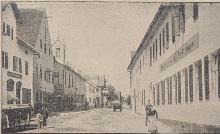
Gänsegasse in Diessen.

Noch hat den Weisen aus dem Morgenlande der herrliche Stern nicht den Weg gezeigt zur armseligen Wiege unseres Heilands in Bethlehem; es fehlen noch fünfzehn Jahre bis zur Geburt unseres Erlösers im fernen Palästina — aber hier, im Lande der Bindeleier, tobt schon die Kriegesfurie. Vom Bodensee her und über die rhätischen Alpen stürmen unaufhaltsam die römischen Legionen unter Tiberius und Drusus in das friedliche Land, Alles sich unterwerfend. Verzweifelt ringen die Männer um ihre Freiheit, treu unterstützt von ihren Frauen; doch vergebens! Die wehrfähige jüngere Mannschaft wird gefesselt fortgeschleppt und in fernen Ländern zum Kriegs-