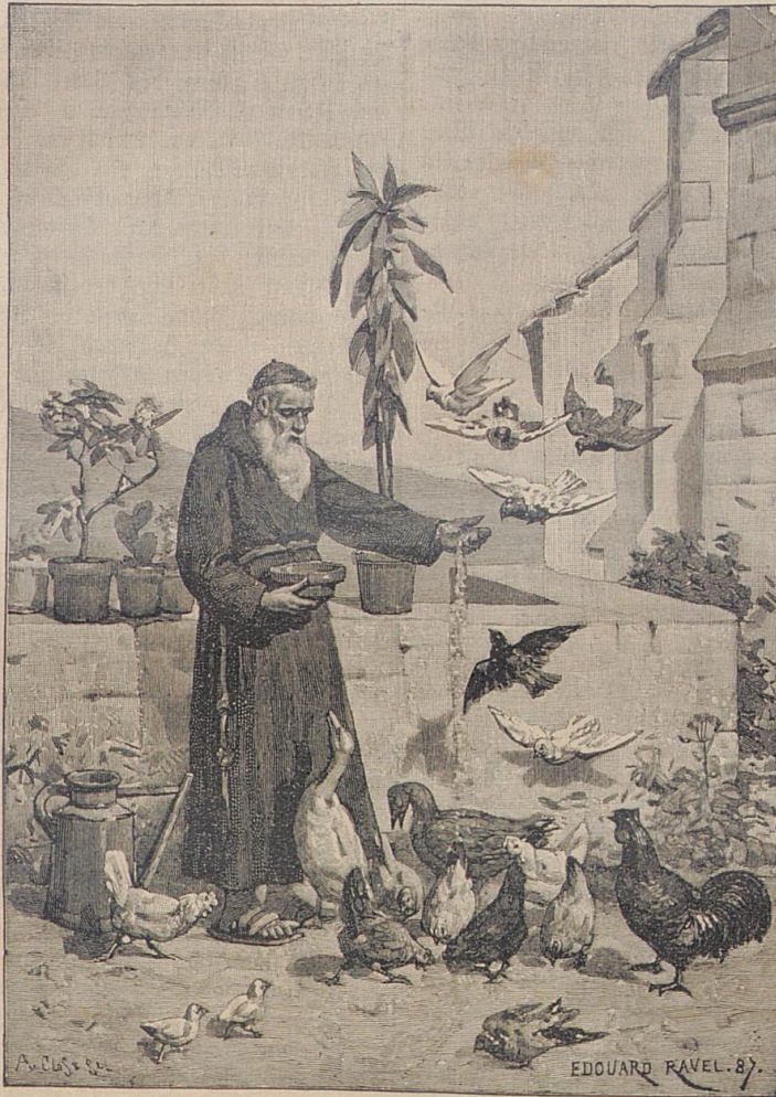
Hungrige Gäste. Originalzeichnung von E. Ravel

Der Stift, den er eben zum Schreiben hatte ansetzen wollen, war seiner Hand entsunken. Was wollte er thun? Er war im Begriff, zerstörend in das Leben