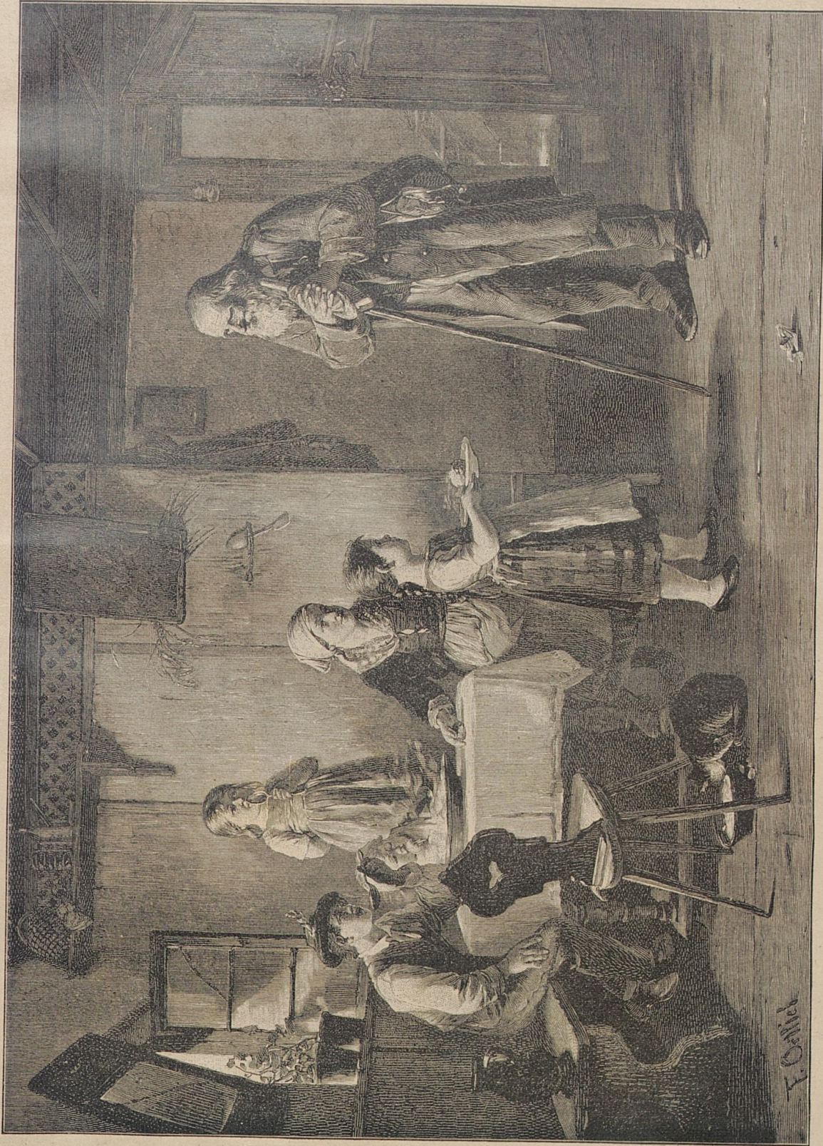
„Vergelt's Gott, Du gutes Kind!“ Nach dem Gemälde von Friedr. Ortlieb.