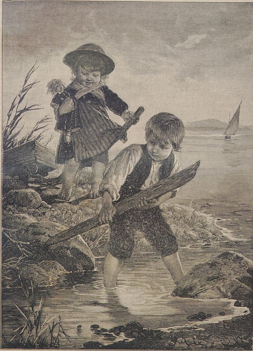
Brückenschlag. Nach dem Gemälde von R. Raupp

Auch die sehr hübsche, freundliche Kirche (1732 neu erbaut, 1751 consecrirt, 1882 u. ff. restaurirt), zu Ehren des hl. Königs und Märtyrers Oswald und der Unbefleckten Empfängniß Mariä geweiht, zu deren Verehrung seit