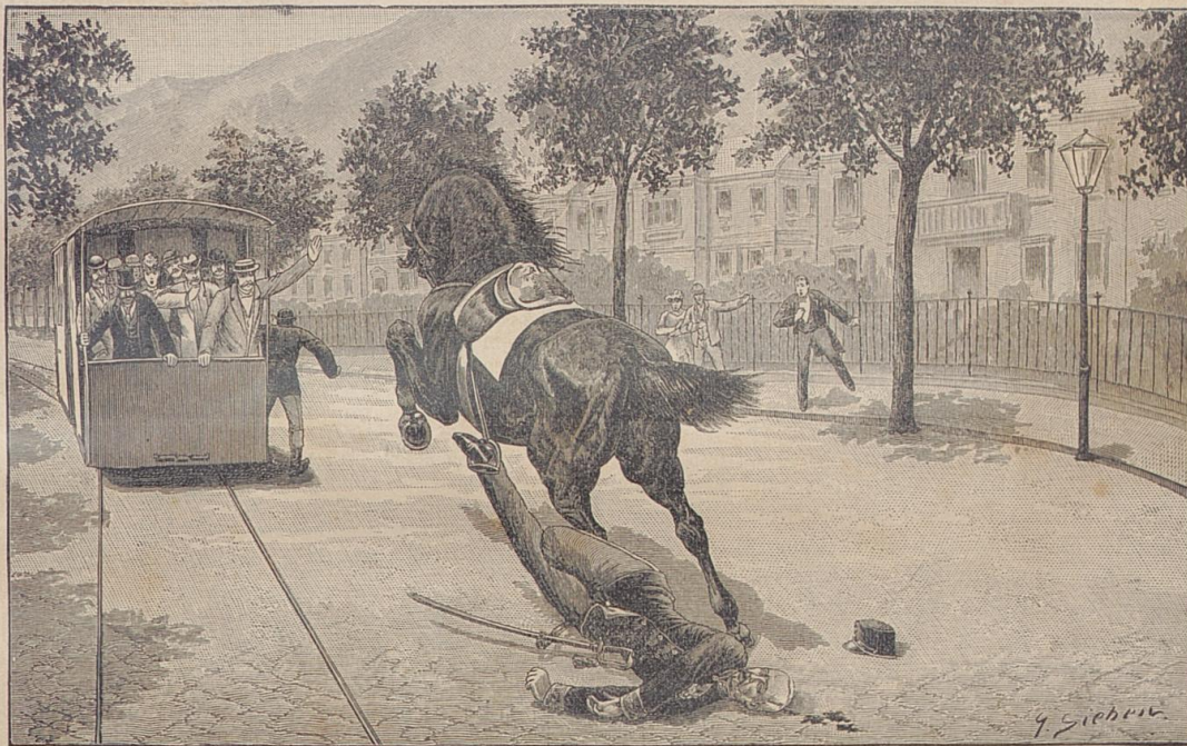
Sturz des Erzherzogs Wilhelm.

"Ja, aber das sag i Dir gleich im voraus" — so stellte sie ihre weiteren Bedingungen. "Wenn i a Dein' Frau sein werd', auf ein andern Namen, als auf Liefel oder Schützenliefel, hörch' i nit — das muaf alles beim Alten bleiben — denn Elisabeth, wie man in der Stadt sagt, das klingt viel zu g'spreizt und nobel."