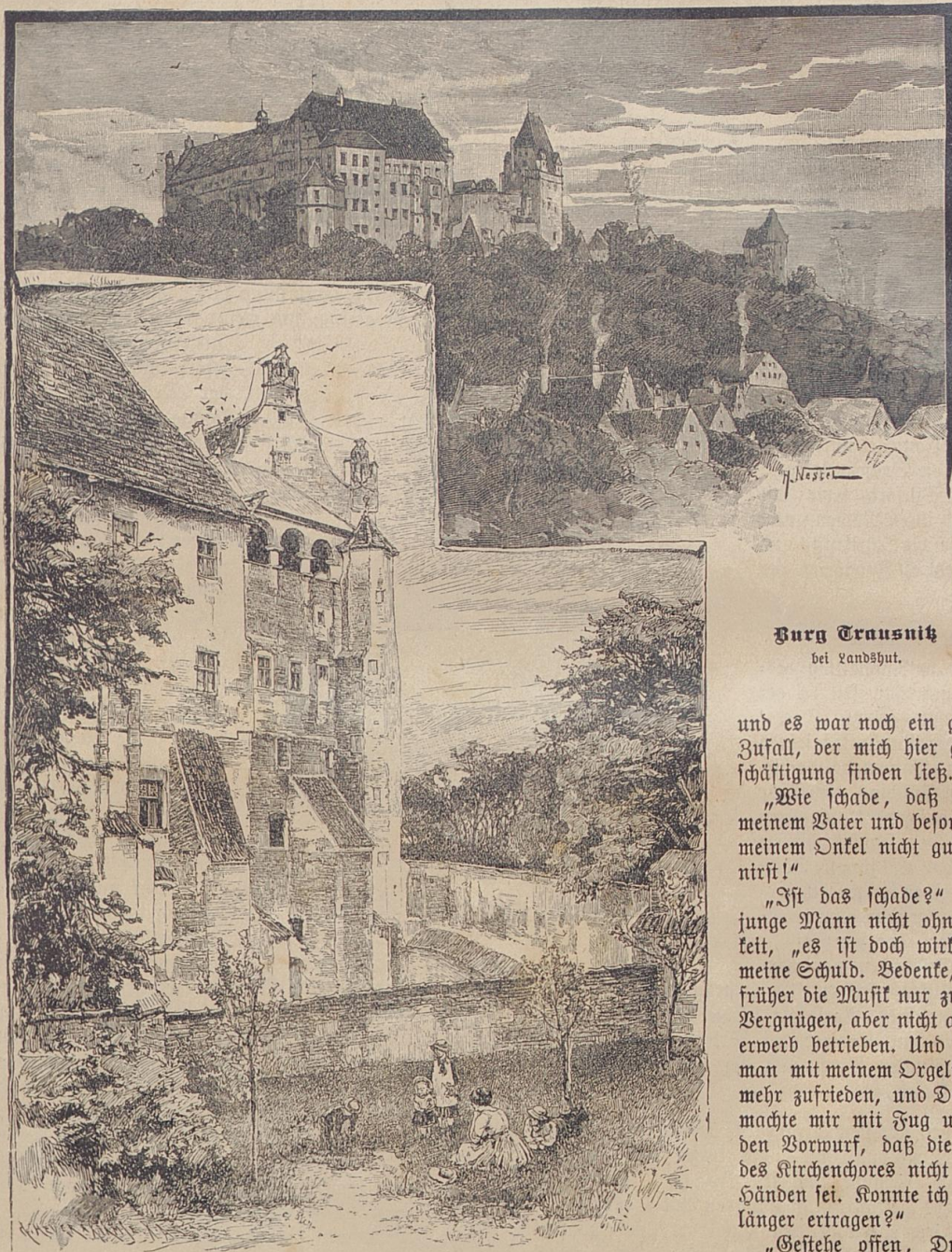
Burg Trausnitz bei Landshut.

"Wohl wahr! Ich sollte den Tag segnen, der mich nach Deutschland, der Heimath meiner Mutter, brachte,