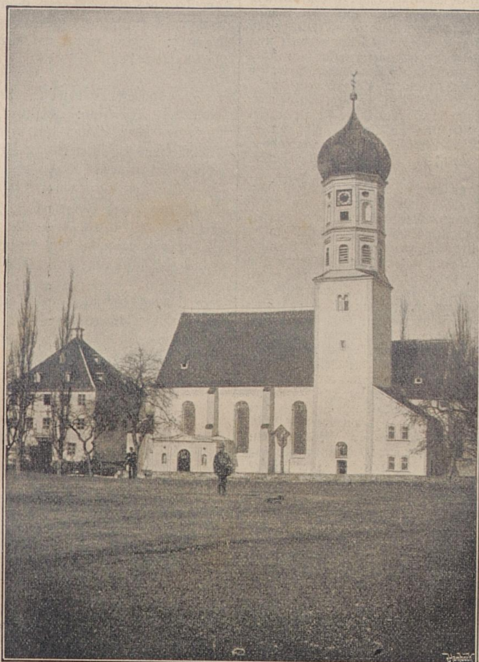
Bedernau. (Schloß und Kirche.)