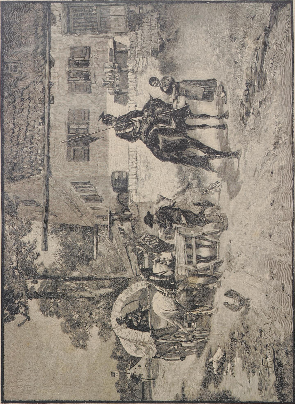
Vor der Schenke. Nach dem Gemälde von M. Pignier.