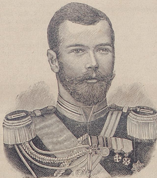
Kaiser Nikolaus II. von Rußland.