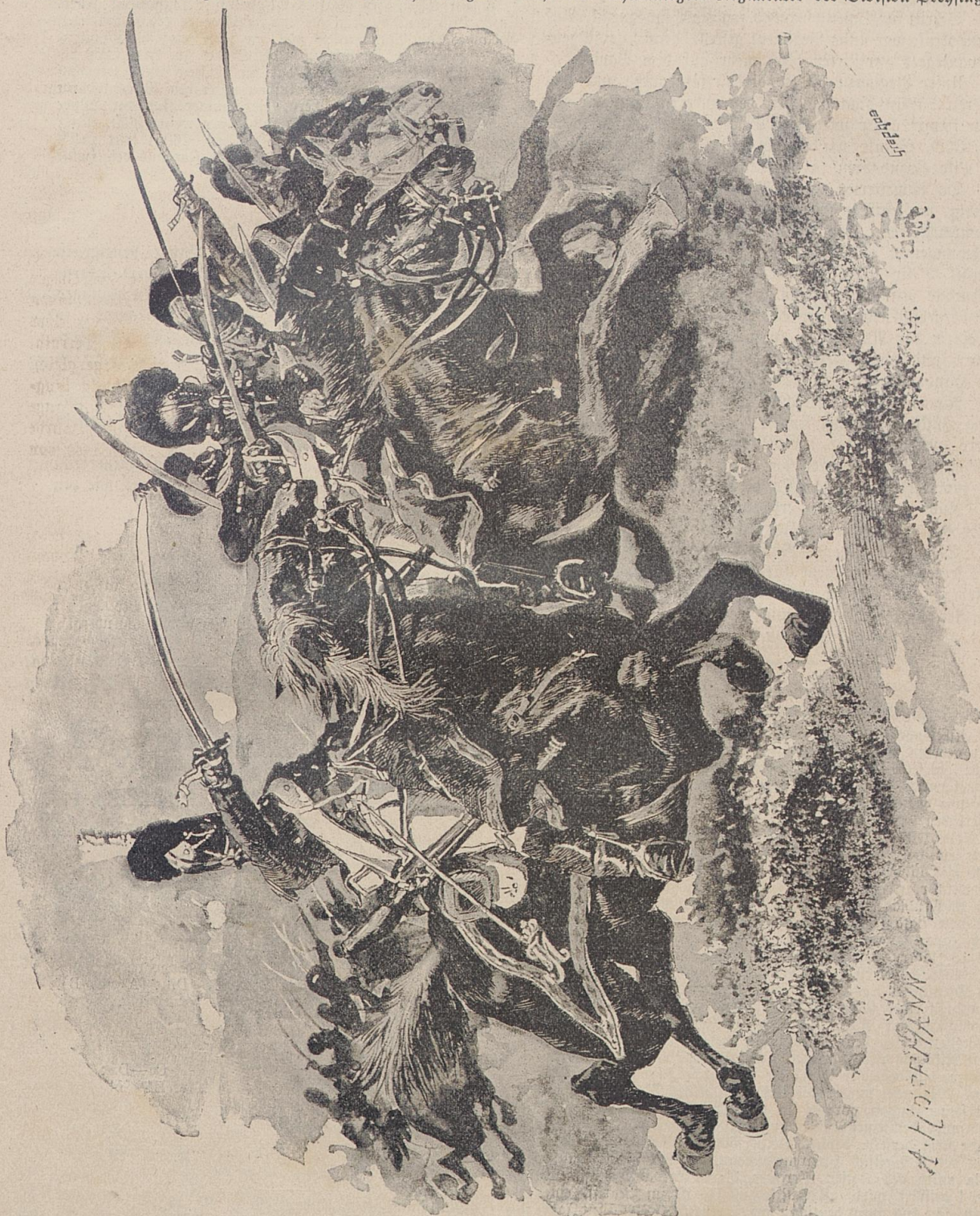
Die Uniformen des königl. bayrer. 4. Chevauleger-Regiments (1804—1812).

Fall war. Nach der Schlacht bei Duchowsszina, wo sich unsere Chevaulegers besonders auszeichneten, zählten sämtliche vier Chevaulegers-Regimenter der Division Prehsing