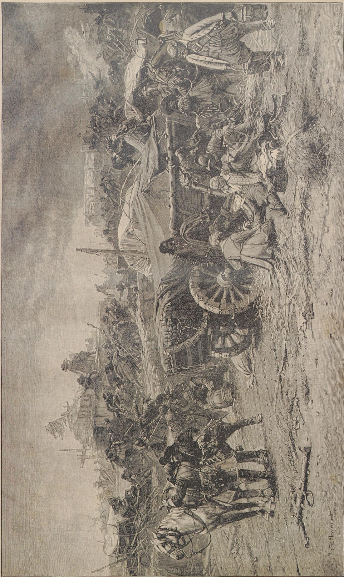
Tilly's Verwundung in der Schlacht bei Rain am Lech. Nach dem Gemälde von P. S. Messerschmidt.