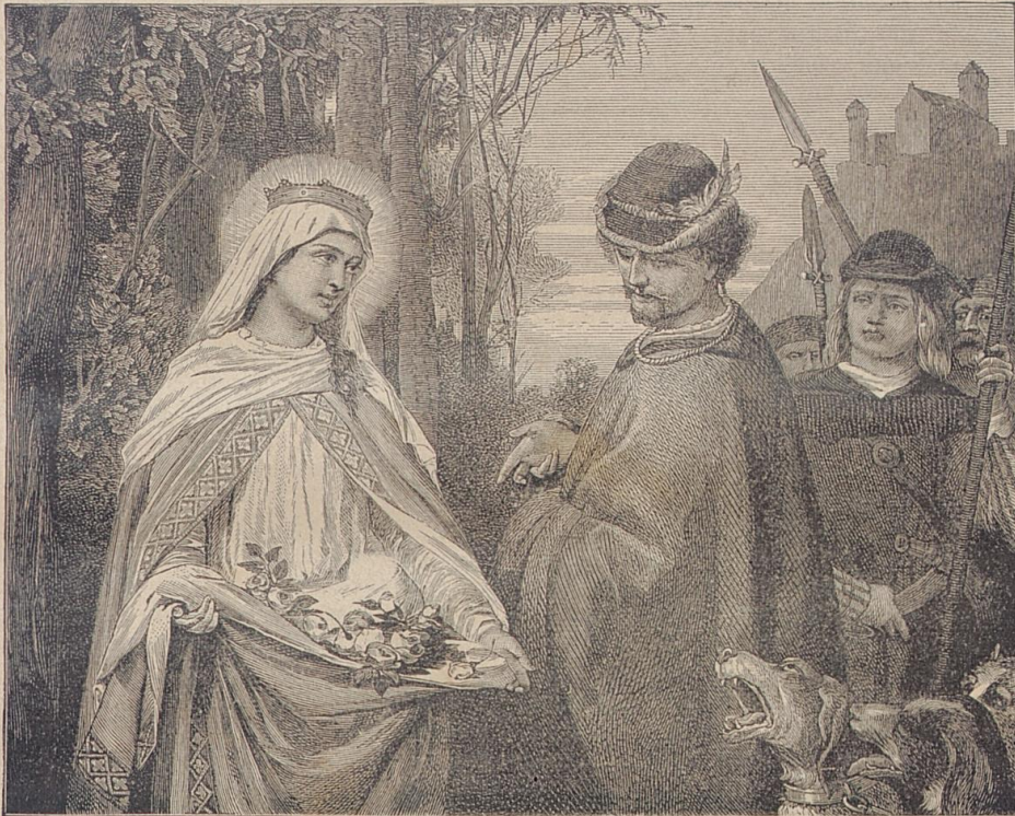
Die Rosen der heil. Elisabeth.

„Ich habe niemals einen Sohn gehabt,“ also sprach Frau Gisela. „Doch heute ist es mir, lieber Klaus, als ob ich einen Sohn in die weite Welt entlassen sollte. Mein Segen geleite Dich!“