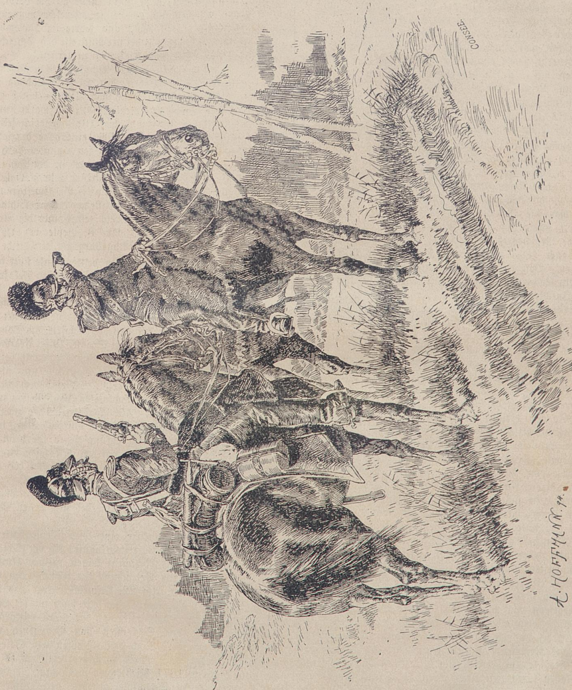
Die Uniformen des kgl. bayer. 4. Chevauleger-Regiments (1870).

auf der Brücke, und mit gezogenem Degen hüten Marschälle von Frankreich den Zugang zu der schmalen Holzbahn, die hinüber nach dem rettenden Ufer führt. Immer furchtbarer ist das Drängen, denn schon