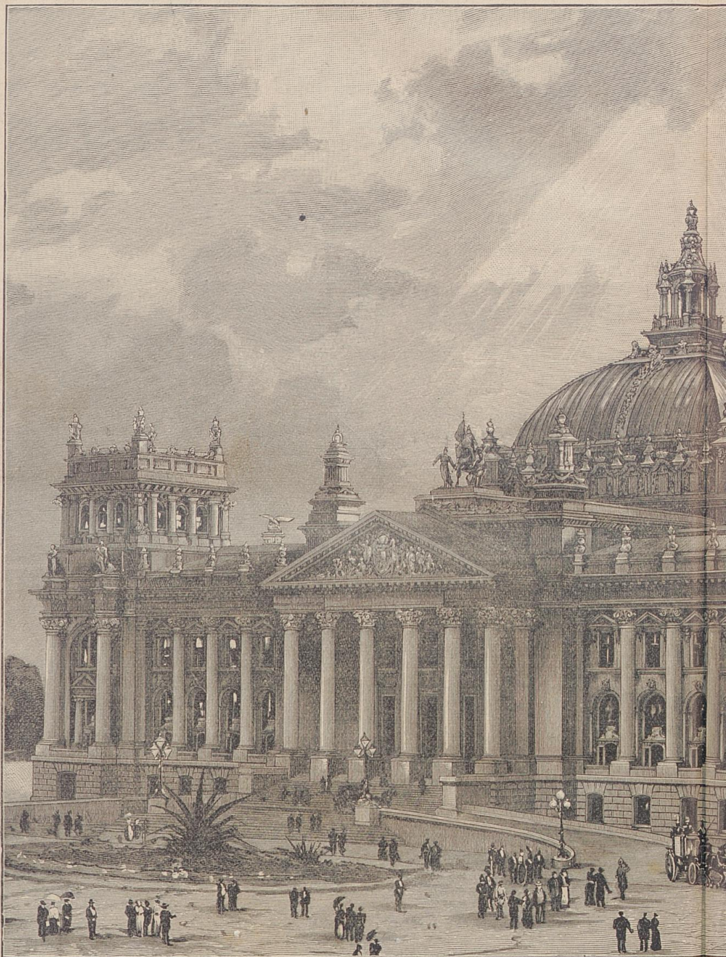
Das neue deutsche Reichstagsgebäude in

kenne. Sie achten nichts, gar nichts. Gestern erst haben Sie diese kleine Gypsstatue, eine griechische Venus oder römische, oder antwerpische, ich verstehe nicht viel davon, zerbrochen, und ich mußte zu Herrn Rubens sagen, daß