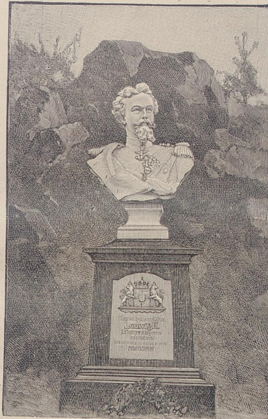
Denkmal für König Ludwig II. in Murnau.

„Wegewart, Du mußt dabei sein,“ flüsterte sie. „Sag' ihm, o sag' ihm, ich warte auf ihn.“ (F. f.)