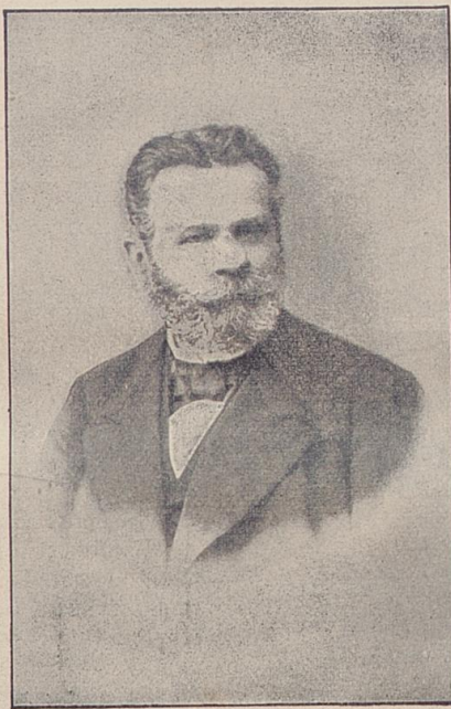
Graf Hartmann v. Fugger, Regierungs-Präsident der Oberpfalz.