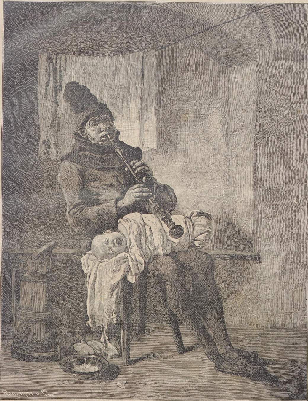
Ein Duett. Nach dem Gemälde von D. Setz.

„Liebe Brüder, ich will Euch nicht verlassen. Wenn ich schon meinem Leibe nach von Euch geschieden bin, so werde ich dem Geiste nach stets bei Euch sein.“