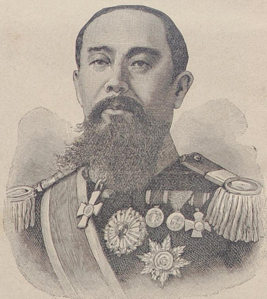
Graf H. Ito, Ministerpräsident.