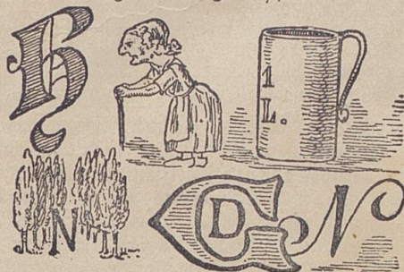
Auflösung des Delphischen Spruchs in Nr. 99: Nase, Gase, Base, Base.