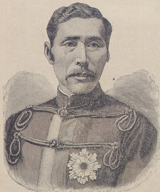
Graf A. Yamagata, Generaloberst.