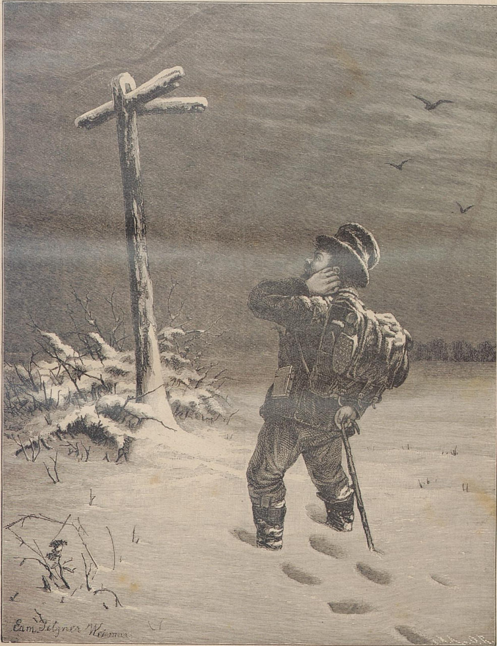
Wohin nun? Originalzeichnung von E. J. J. J.

Auf dem Vorplage dröhnten schwere Schritte, und bald darauf trat ein hagerer, großer Mann in das Zimmer. Unter den dunkeln Brauen blühen ein Paar stechende Augen hervor, die im Verein mit der gerunzelten Stirne und den schmalen, zusammengekniffenen Lippen