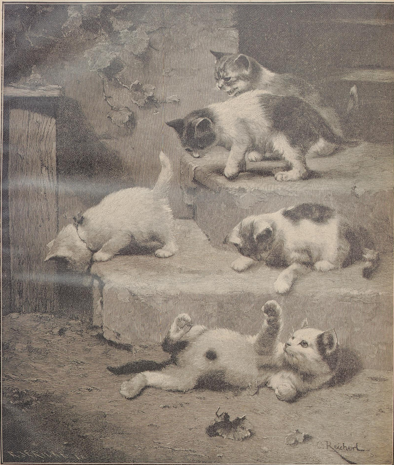
Gefährlicher Abstieg. Nach einem Gemälde von Karl Reichert