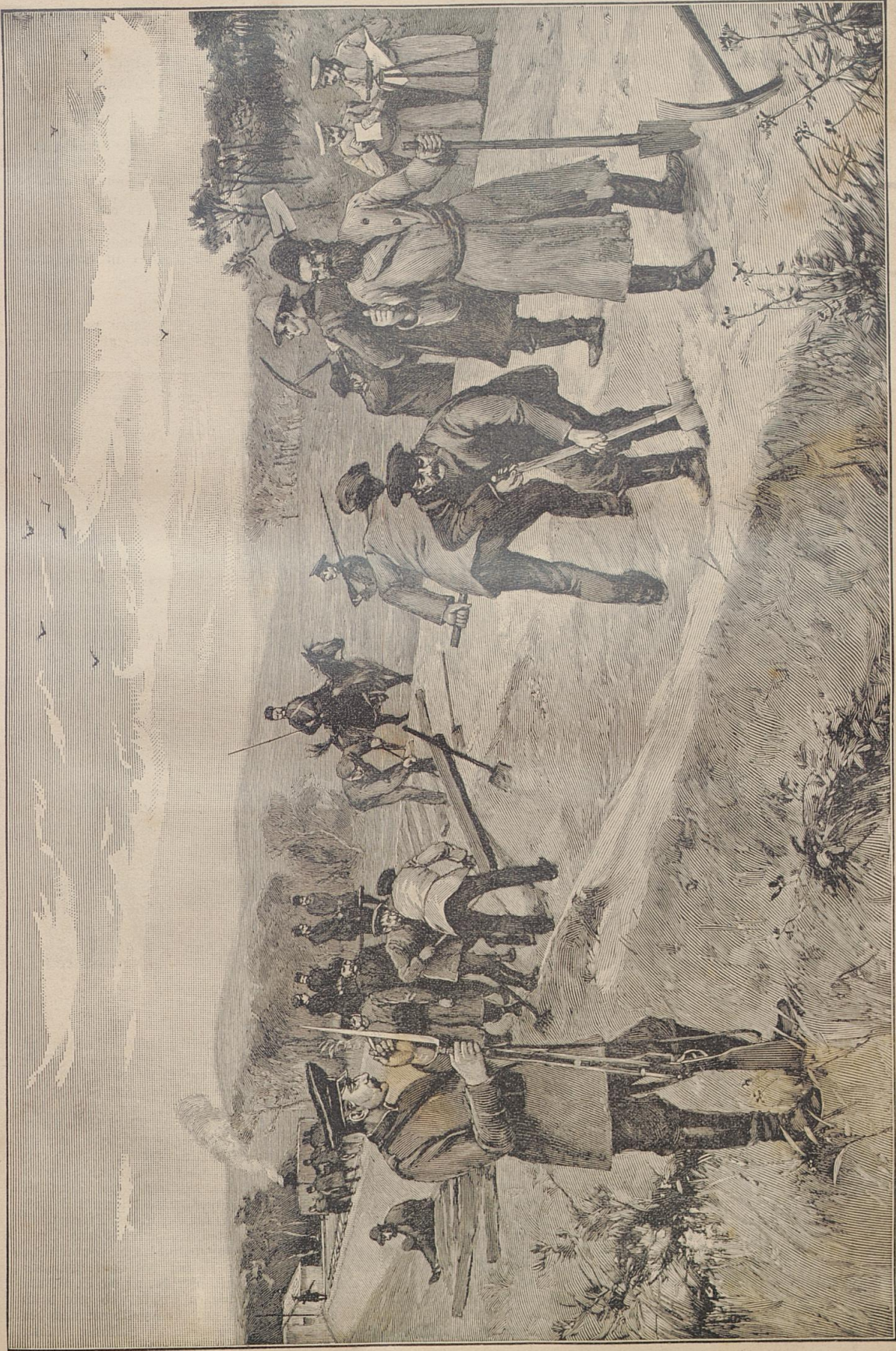
Die Sibirische Eisenbahn.