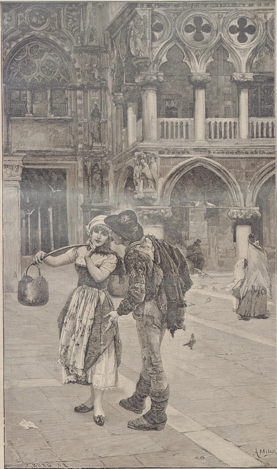
Auf dem Markusplatze in Venedig.