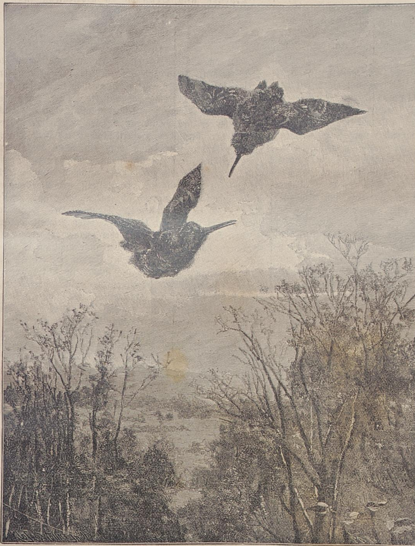
Oculi, da kommen sie!

nicht vergönnt, Euch zu warnen. Doch Ihr versteht mich wohl nicht. Ihr könnt nicht wissen, daß ein unbedeutendes Mädchen wie ich in Dinge eingeweiht ist, vor denen das Herz eines Mannes erbebt. Ich bin Euch Rechenschaft schuldig über meine Worte sowohl wie über mein Handeln, und ich will sie Euch geben; wer weiß, ob dies nicht die letzte Frist ist, die mir hierzu das Schicksal gewährt."