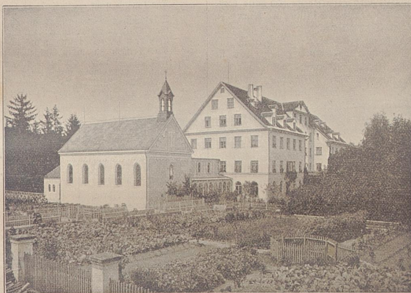
Cretinen-Anstalt Deybach bei Lautrach

Das jährliche Kostgeld beträgt 240 M., kann jedoch nur für die wenigsten Pfleglinge geleistet werden; nur durch die gnädige Fürsorge der hohen kgl. Regierung und Unterstützungen edler Wohlthäter ist die Aufnahme so vieler Cretinen ermöglicht.