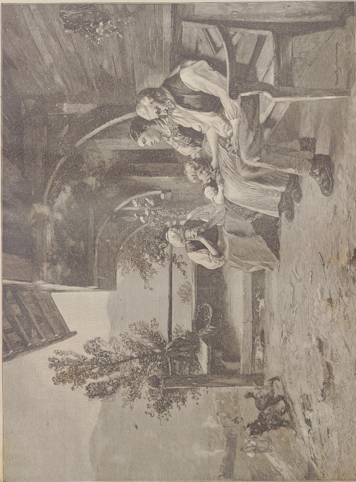
Beim Klang der Abendglocken. Nach dem Gemälde von Hans Bachmann.