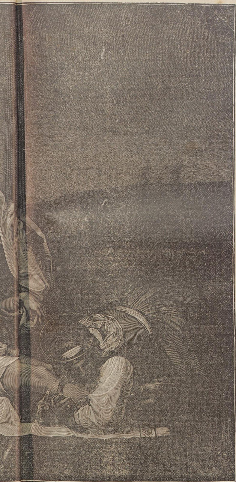
thme (i vom Kreuze.

und auf seinen Schultern getragen hatte, der so sanft war gegen ein krankes Kind, wie er später Israels Feinden schrecklich wurde.