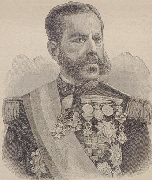
General Valeriano Weyler y Nicolau, der neue Commandeur der spanischen Streitkräfte auf Cuba.

„Viele der Veilchen zusammengeknüpft, das Sträußchen erscheint Erst als Blume; du bist, häusliches Mädchen, gemeint.“