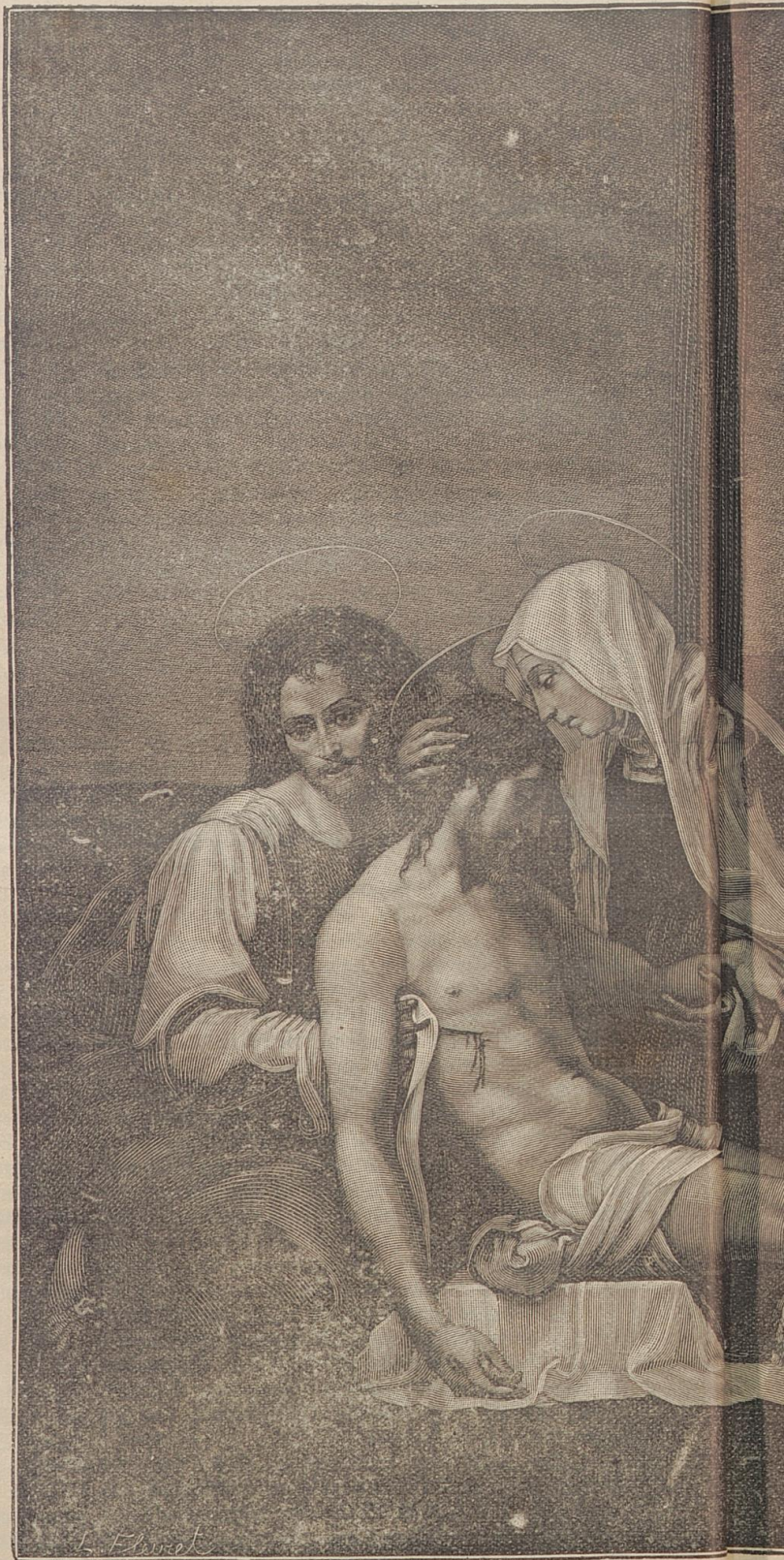
Die Abnahme (i von

In späteren Tagen wurde so manchemal diese letzte Aeußerung Theras wiederholt, als Judäa längst vor seinen Feinden Ruhe hatte, und er längst ein alter Mann war. Wenn er unter seinem Wein- und Feigenbaum saß und niemand zu fürchten brauchte, dann konnte er nicht müde werden, jene fürstliche Gestalt, die einen so tiefen Eindruck auf sein kindliches Gemüth gemacht hatte, daß er dieselbe im Gedächtniß behalten hatte, zu beschreiben. Er sprach mit hoher Begeisterung von dem fürstlichen Manne, der ihn auf seine Arme genommen