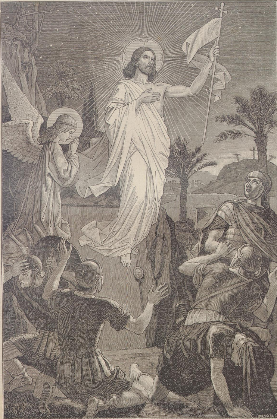
Christus ist erstanden!