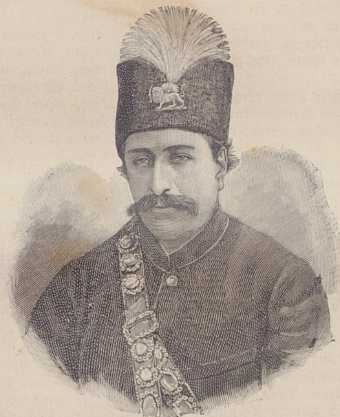
Mussaffer Eddin, der neue Schah von Persien.

Aber obgleich die Einladung höflich und freundlich