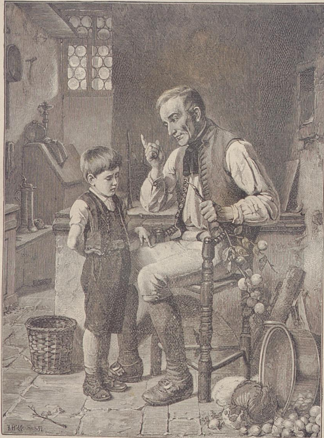
Eine Straßpredigt. Von F. Hiddemann.

nur unvollkommen erfüllt. In den Straßen, wo viel Radfahrer verkehren, ist also das Leberschreien des Straßendamms immer mit einem gewissen Risiko verbunden. Ich kenne Leute, die in Folge langerlebung sich mit der größten Gemüthsruhe durch ein Gewirr von bewegten Droschken, Omnibussen und sogar Pferdebahnen hindurchschlängeln, aber über die heimtückisch dahersausenden Zweiräder nervös und — unhöflich werden können. In der That wirkt es, namentlich am Abend, recht unangenehm auf die Nerven, wenn da plötzlich ein Ding von unsicheren Umrissen hart an einem vorbeisauft, unerwartet aus dem Dunkel aufgetaucht und spurlos wieder in's Dunkel verschwindend. Ich möchte wünschen, daß die Zweiräder auf den Straßen einen wirksamen Lärmapparat hätten, der unaufhörlich im Betriebe ist, und zwar im