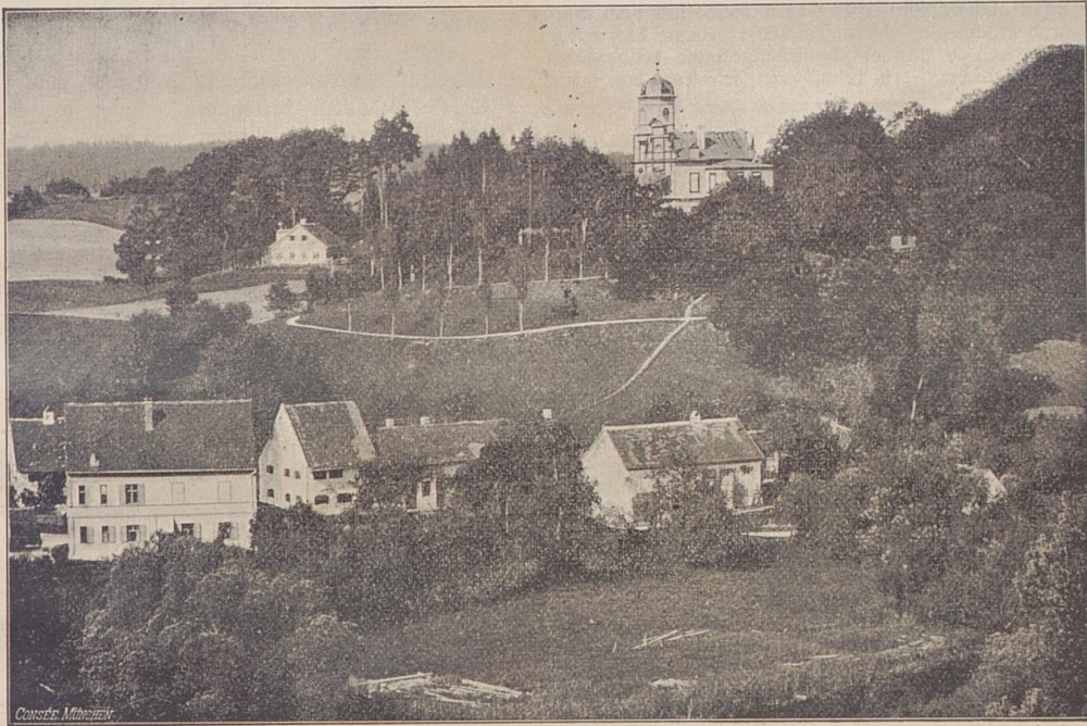
Wildenroth an der Amper.