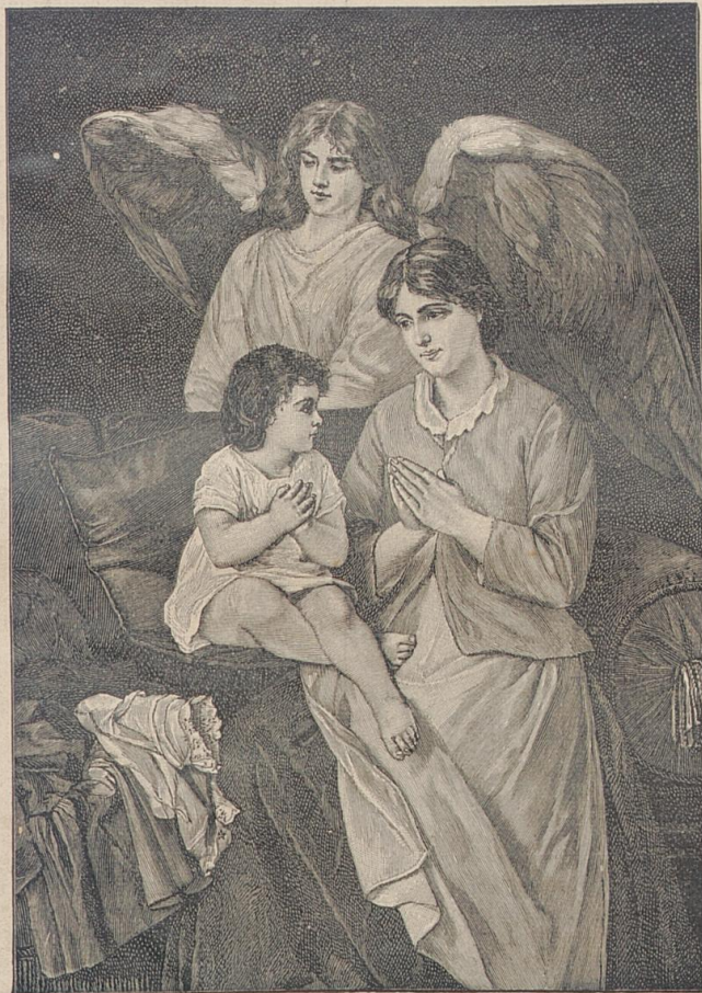
Erstes Gebet. Von W. Kraß.

Berühmt und viel besucht ist die vor einigen Jahren auf dem Falkenstein erbaute Lourdesgrotte, welche, in natürliche Felsen eingehauen, umgeben von der großartigen Gebirgsnatur, wohl die schönste nicht nur in der Diözese, sondern weit über dieselbe hinaus sein dürfte. Zahlreiche Andächtige wallen im Laufe des Sommers zu der herrlichen Grotte auf dem Falkenstein.