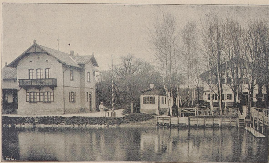
St. Alban (Villa und Gasthaus).

„Ich beruhige mich“, keuchte der Wirth. „Bleiben Sie diese Ferien bei uns, wir wollen dem Velletri wacker