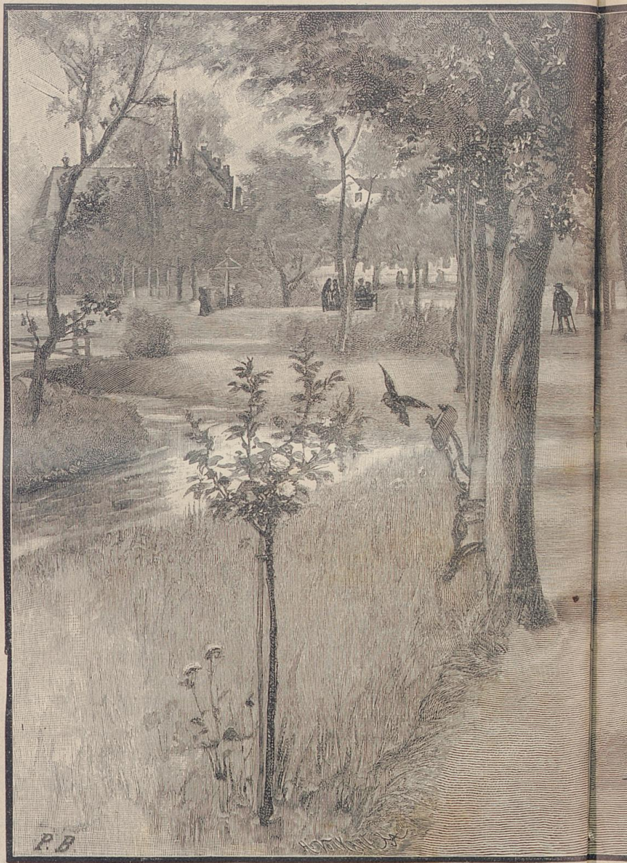
Genssen. Von P.

ungünstige Gesundheitsberichte; Epidemien, die namentlich für die Kinder gefährlich, waren aufgetreten, doch war glücklicherweise die Stadt . . . mit ihrer nahen und fernen Umgebung verschont geblieben. Da brach dennoch das Scharlachfieber aus, und Günther's ältester