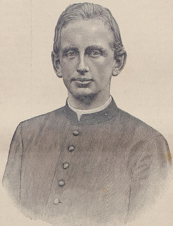
Prinz Max, Herzog zu Sachsen.

Vor ihrer Abreise machte sie noch einige Einkäufe. Sie betrat ein Magazin am Broadway und verlangte schwarzen Seidensammet zu sehen. Der junge Mann, der