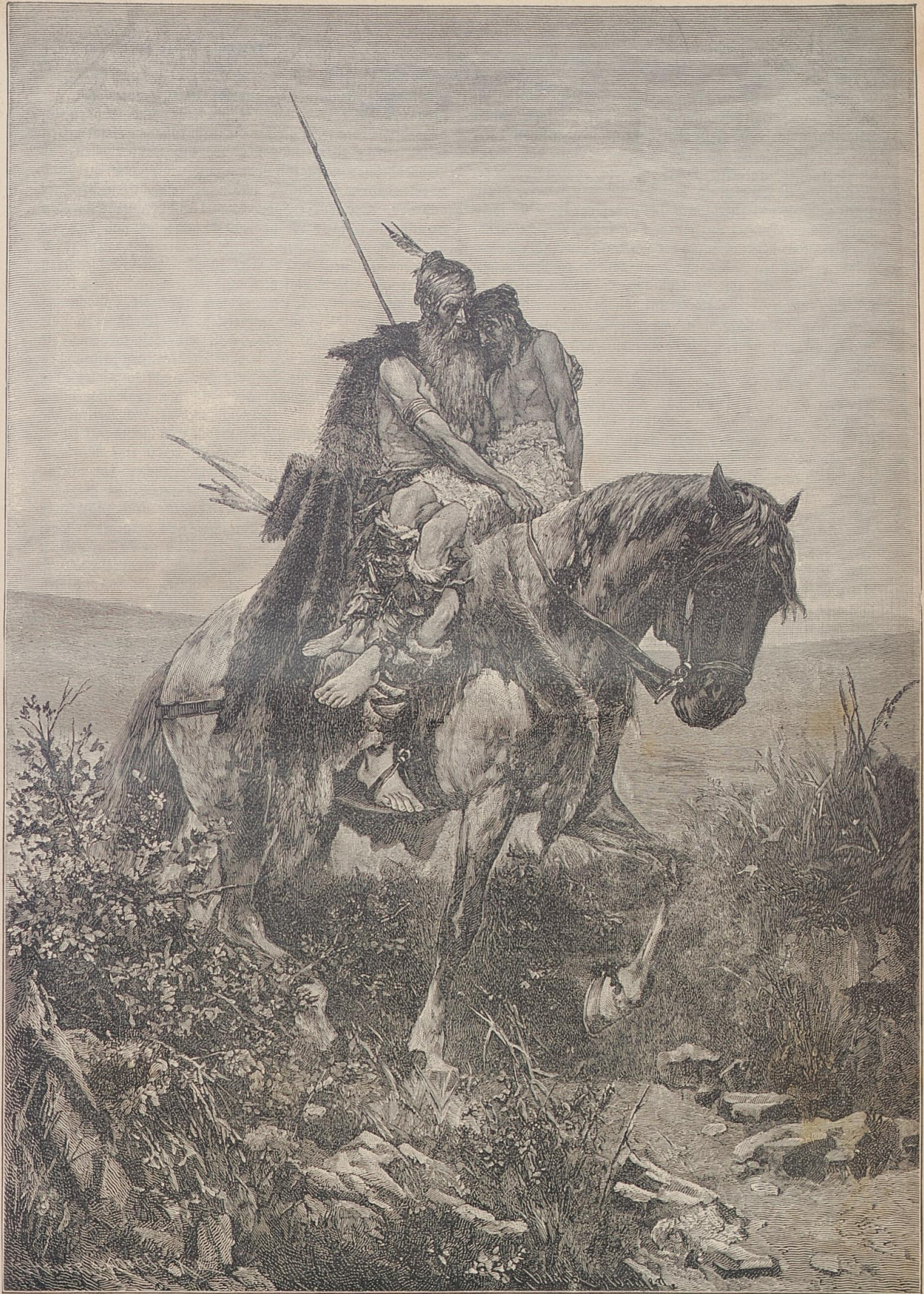
Der letzte Ritt. Nach dem Gemälde von G. Urlaub.