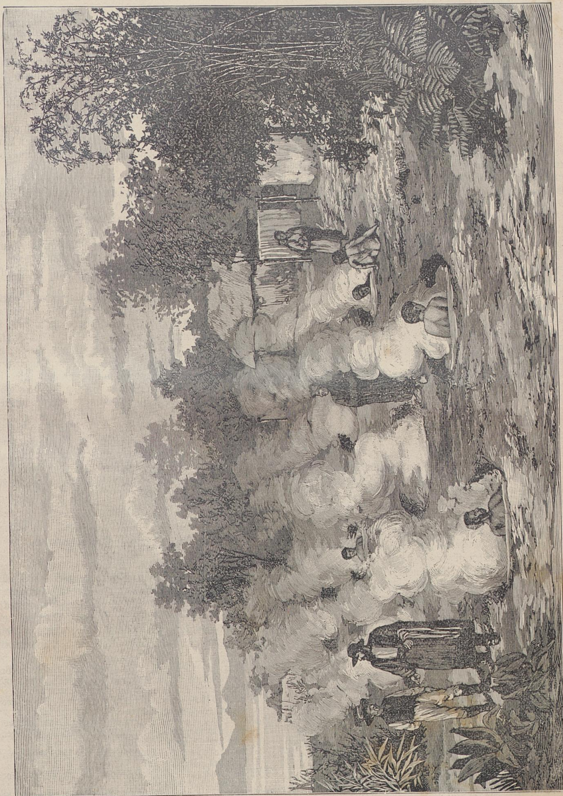
Die heißen Quellen auf Neuseeland. Nach einer Zeichnung von R. Deffinger.