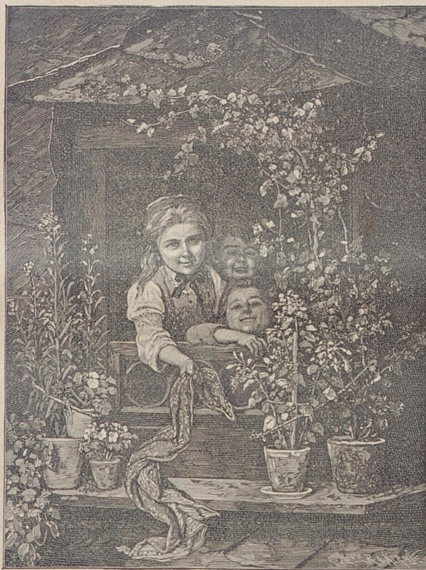
Das Dachfensterchen. Nach dem Gemälde von J. G. Meyer von Bremen.

rosafarbene Sinterterrasse gewiß die schönste. Vom frischen Grün der Hügel umrahmt, mit einem zarten Schimmer vom duftigsten Hellrosa übergoßen, machte dieses entzückende Bauwerk einen überwältigenden Eindruck. Und neben seiner einzigartigen Schönheit spendete dieser Bau noch alle Annehmlichkeiten eines wohleingerichteten Bades. Da waren kleine Bannen für Einzelbäder und große Becken für „Schwimmer“, alle von der Mutter Natur eigenhändig erbaut, gespeist und geheizt vom Siedgrad bis zum lauen Bade. Der warme See selbst war ein Wunder für sich, seine Wasser waren nicht gleichmäßig warm, sondern zeigten Temperaturunterschiede, die zwischen 15 und 40° schwankten. Da kam der 10. Juni des Jahres 1886. Drohende Zeichen: Erdstöße, unterirdisches