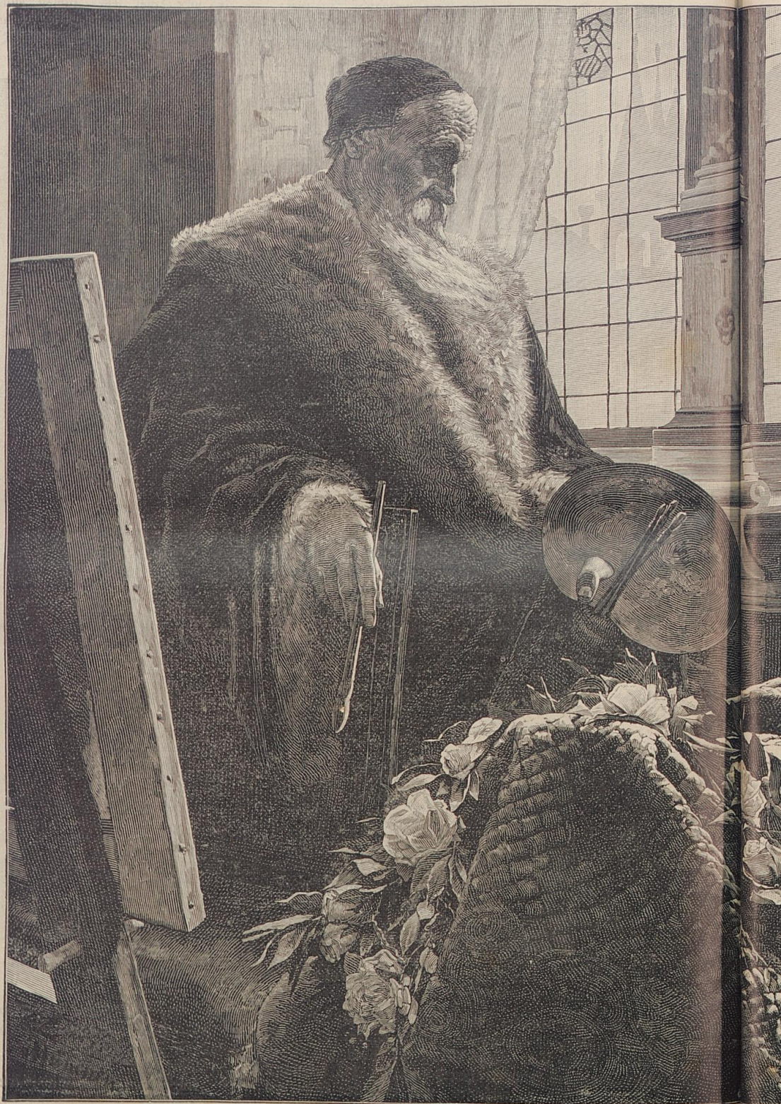
Gintoretto an der Leiche seiner Gattin.