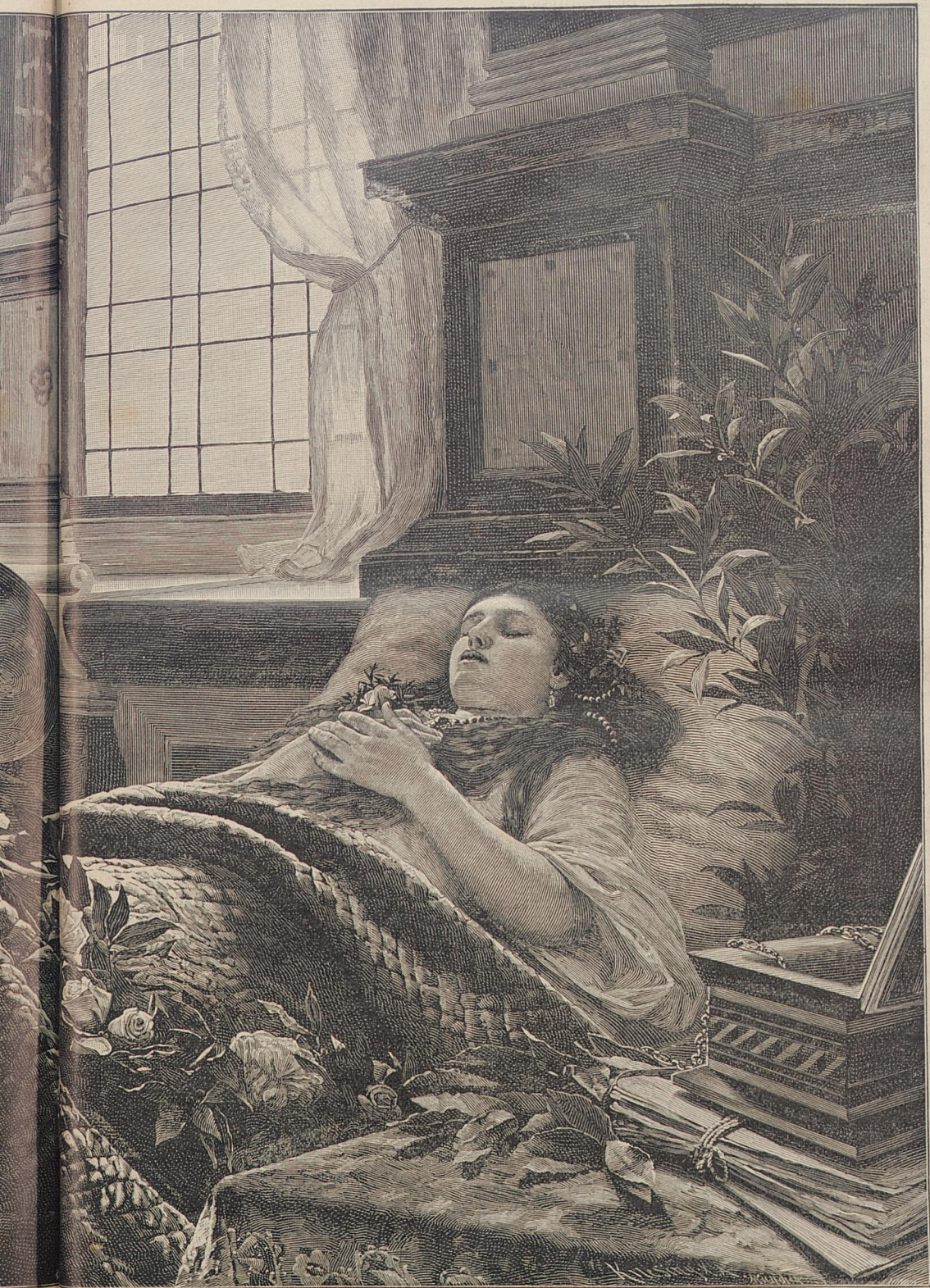
iner G., Nach dem Gemälde von G. Koch.