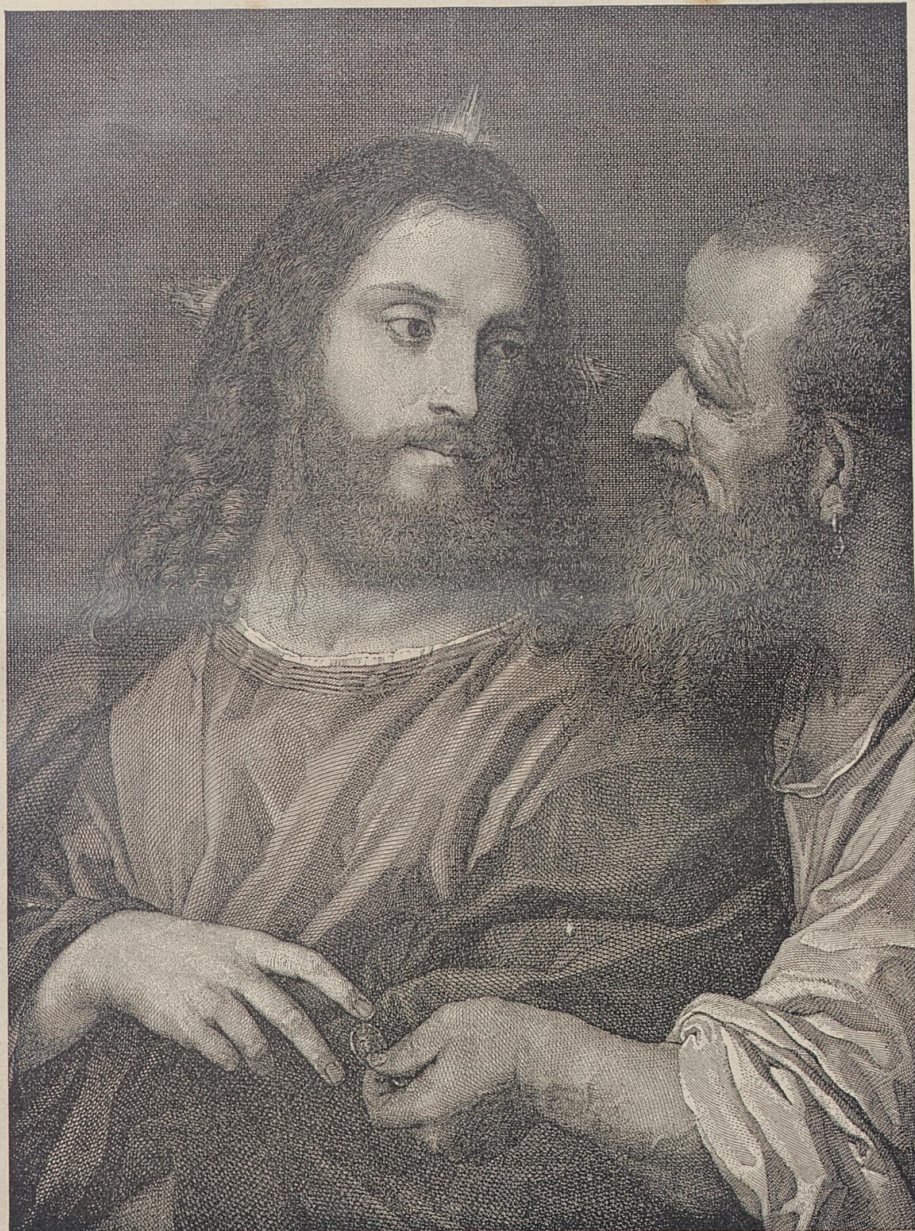
Der Zinsgroschen. Nach dem Gemälde von Tizian.

Es war einer jener kühlen Maitage, welche uns für das frühe Vertrauen in die Allmacht des Frühlings strafen und oft den Blütenflor des Jahres heimtückisch