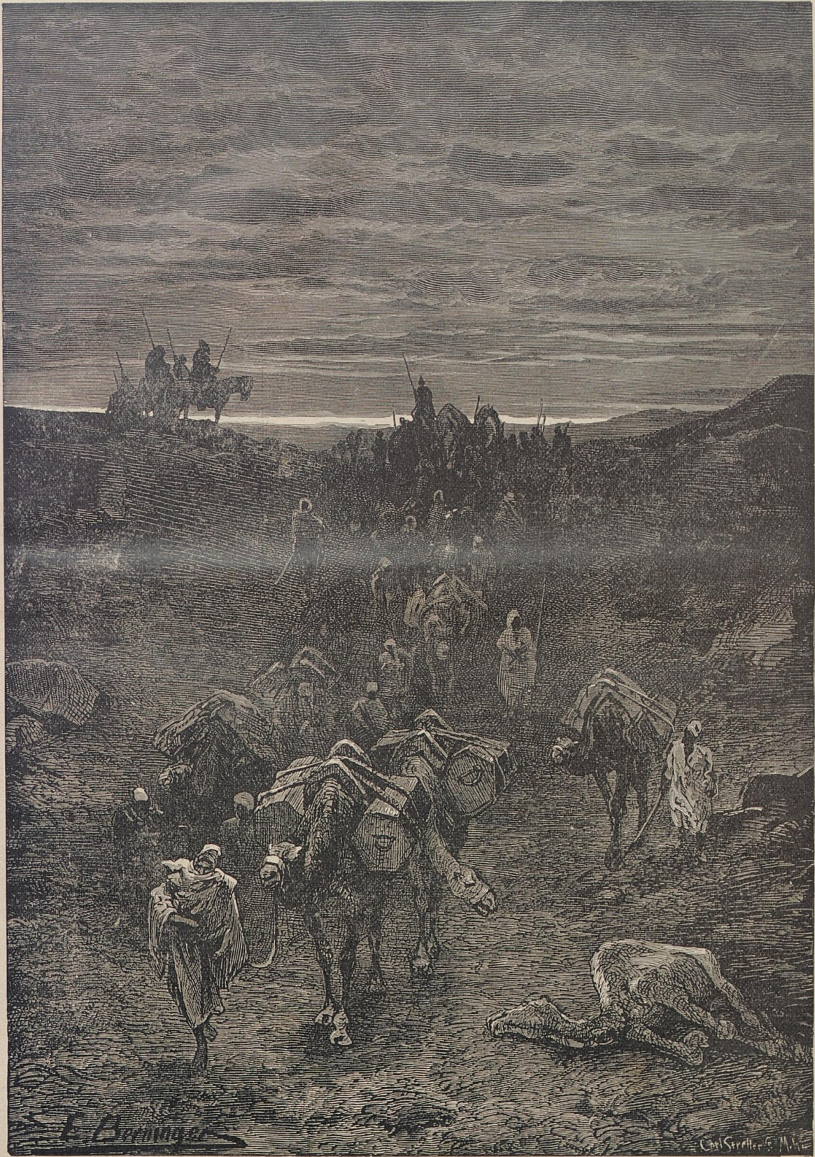
Die Leichenkarawane. Nach einer Originalzeichnung von E. Berninger.