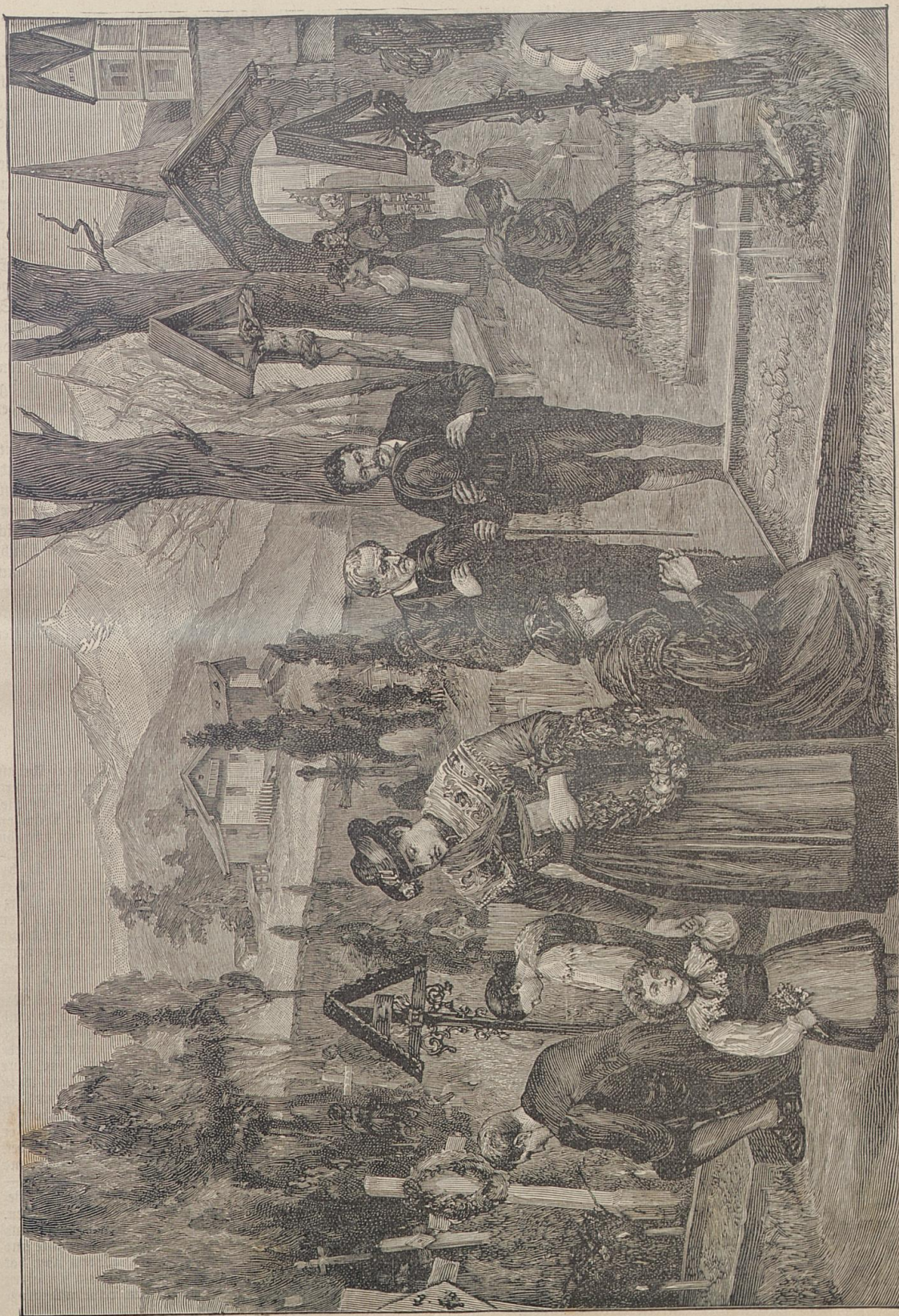
Allerfeelen in Tirol.