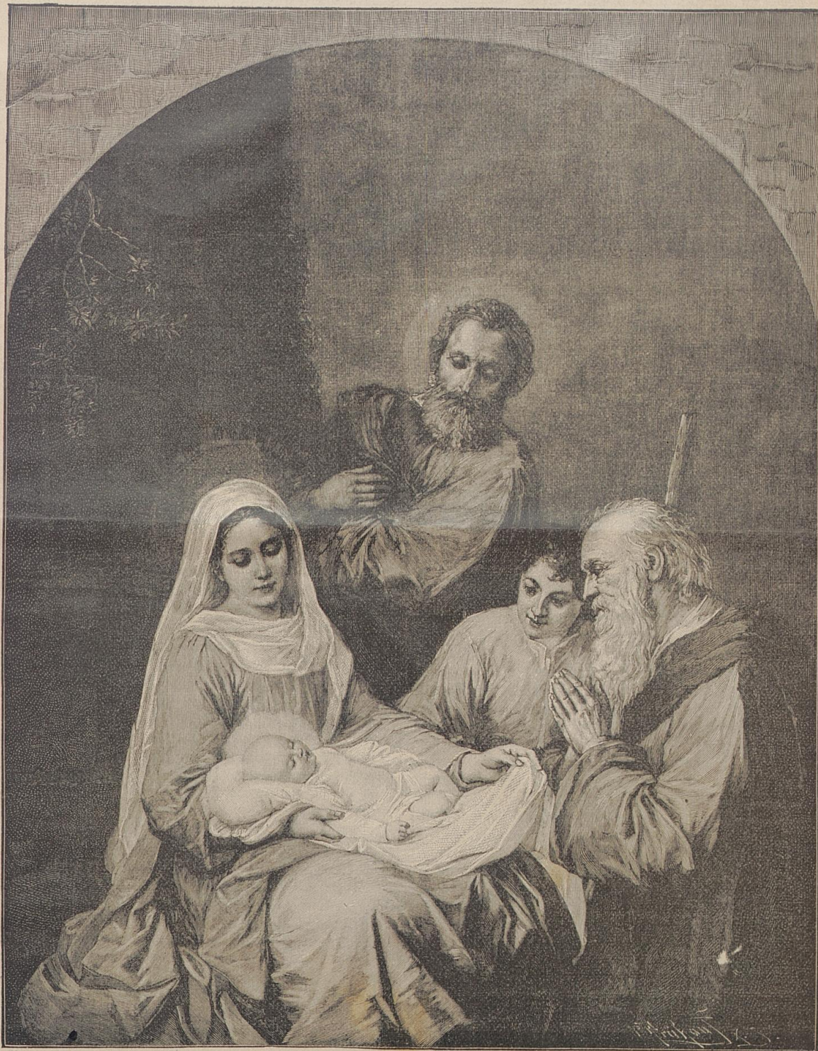
Heilige Familie. Nach dem Gemälde von B. Coletti.